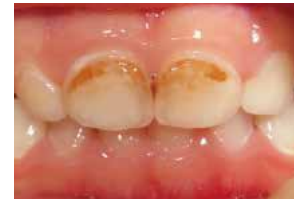
最初にむし歯になりやすい上の前歯

また、この時期は味覚が発達する大事な時期でもあるので、おやつには甘い味だけでなくいろいろな自然の味を与えることが大切です。