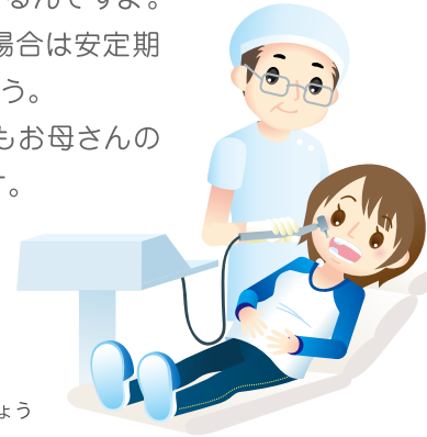
むし歯の治療は、 妊娠中期に行いましょう