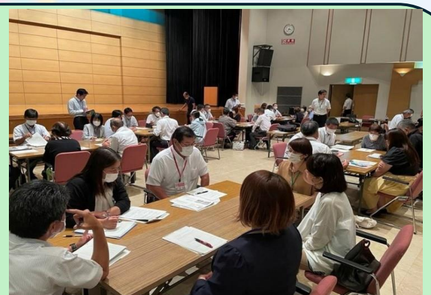
ワークショップ (地域・学校で語り合う場)

宮崎・南那珂・児湯の3地区とも、学校と地域・家庭・企業が「どんな子どもを育てたいのか」「どんな地域をつくりたいのか」を子どもを中心に考え、目的・目標を共有し、連携・協働することで、持続可能な地域社会の構築を目指す方策について考えました。実践発表や講話、ワークショップを通して、地域総ぐるみで地域の未来を担う子どもたちを育てていくことの大切さやその土台となる対話を通しての「つながりづくり」の重要性についての理解を促進することができました。(中部教育事務所)