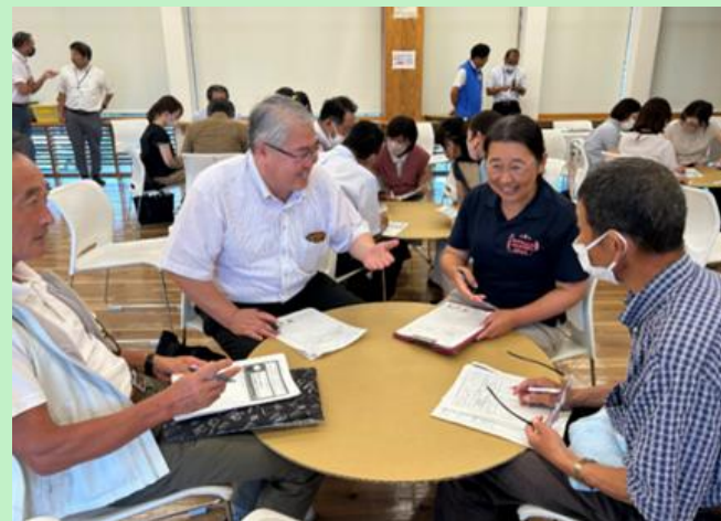
ワークショップ (西諸県地区)