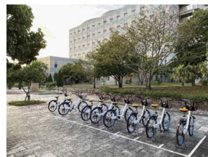
シェアサイクルのサイクルポート

重要物流道路制度を契機とし、全国各地域において「新広域道路交通ビジョン・計画」を策定することとなり、本県においても、宮崎県の実情や将来像を踏まえた概ね20～30年間の中長期的な観点から広域的な道路交通の今後の方向性を定める「宮崎県新広域道路交通ビジョン」及び「宮崎県新広域道路交通計画」を策定しました。