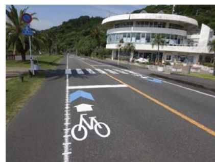
自転車通行空間の整備