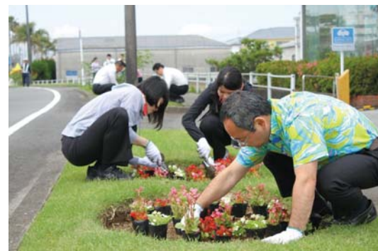
● フラワーマンス空港線花植 (宮崎市)

令和4年3月31日現在、県内の214団体と協定を締結し、道路環境保全活動に取り組んでいただいています。