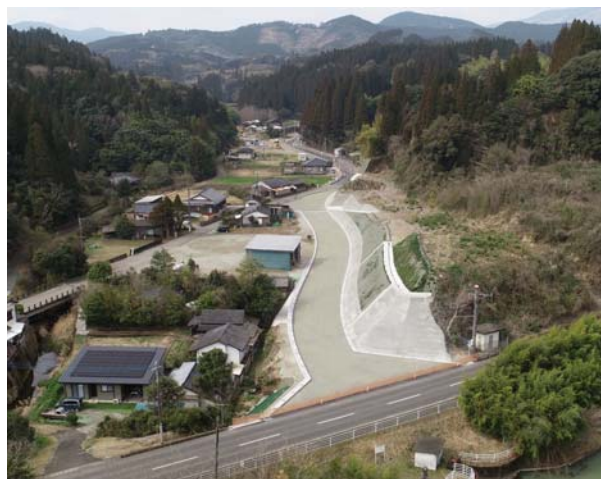
酒谷榎原線 種子田工区