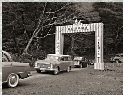
昭和35年霧島道路開通