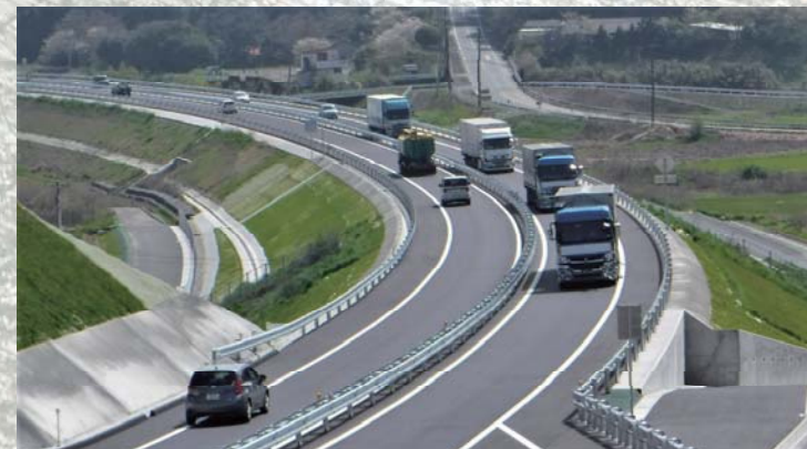
都城志布志道路 金御岳IC～末吉IC