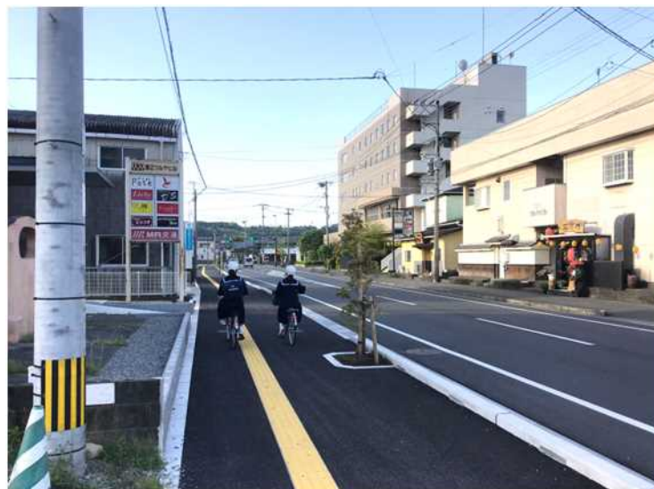
(一) 杉安高鍋線 洗井工区