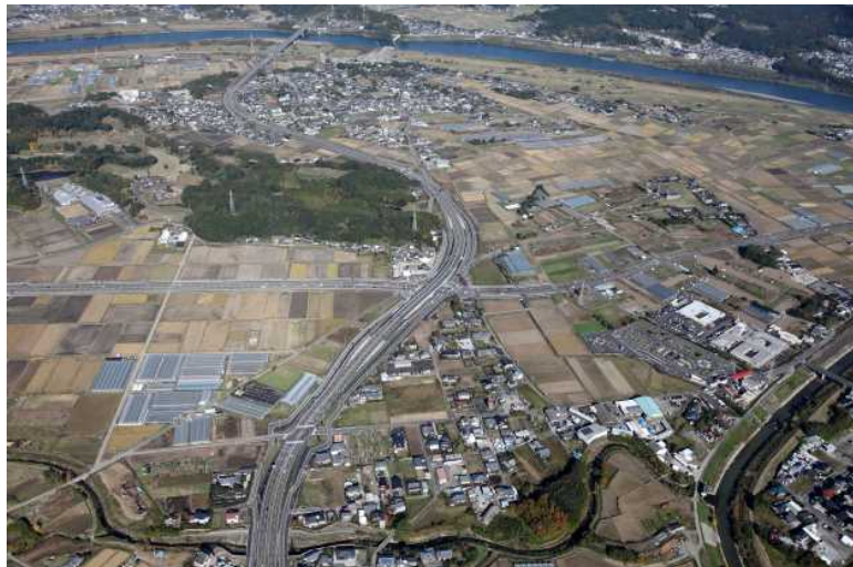
(主) 宮崎西環状線 松橋工区