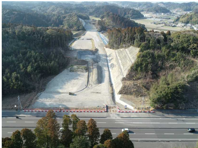
(主) 宮崎西環状線 古城工区