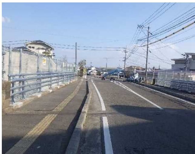
(一) 土々呂日向線 橋梁補修