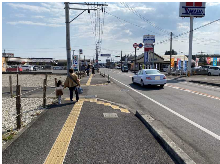
(主) 高鍋高岡線 歩道整備