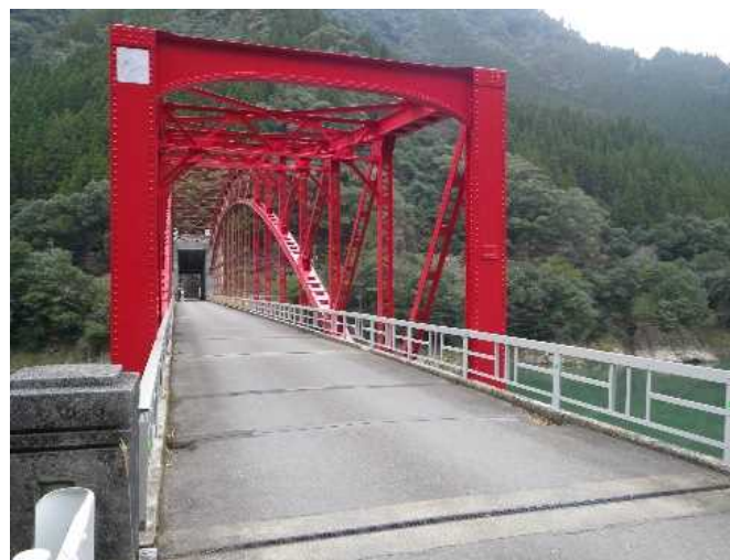
(主) 東郷西都線 橋梁補修