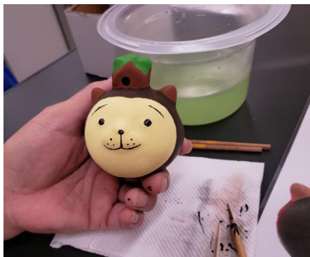
(佐土原人形絵付け)