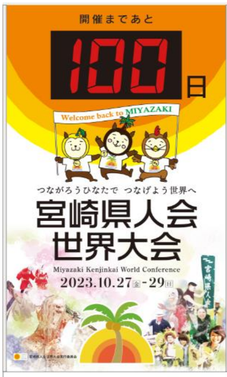
(カウントダウンボード)