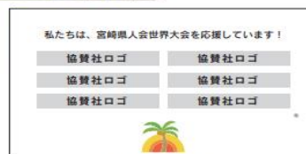
おさえ (協賛社あり)