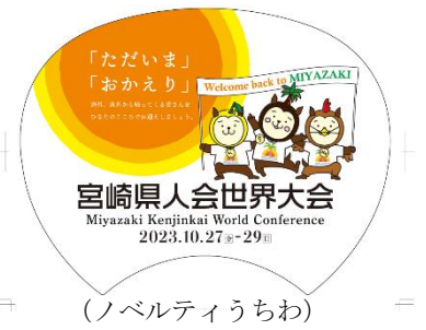
(ノベルティうちわ)