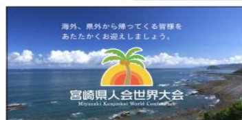
おさえ (協賛社なし)