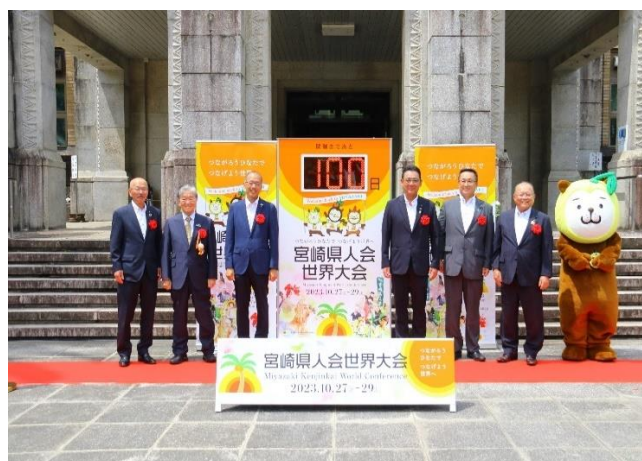
(カウントダウンボード除幕式)