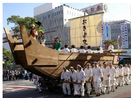
(宮崎神宮御神幸祭)