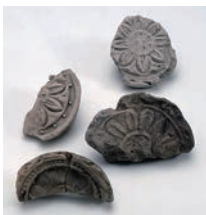
軒丸瓦 (日向国分寺跡/西都市)