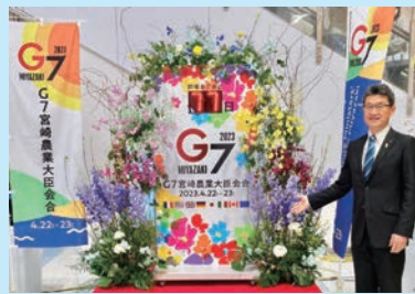
G7宮崎農業大臣会合開催記念フラワーイベントでの写真

本会合が実りあるものとなり、世界の食と農の未来を照らす機会となることを願っています。