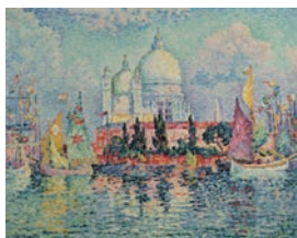
ポール・シニャック 「ヴェニス、サルテ教会」