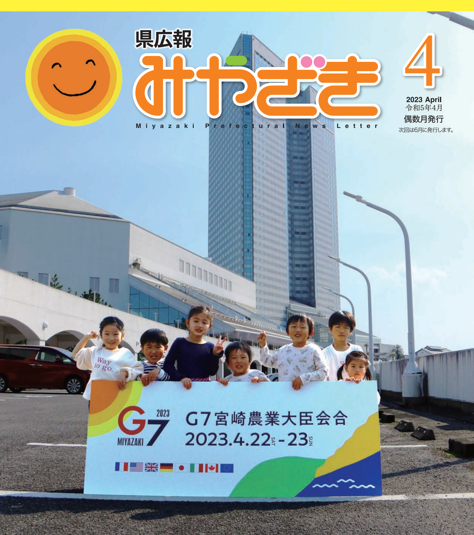
G7宮崎農業大臣会合の会場・シーガイアコンベンションセンター (施設管理者の許可を得た上で安全面に配慮して撮影しています)