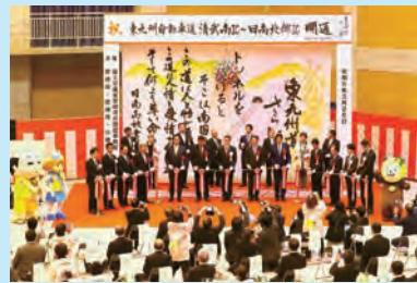
東九州道「清武南IC～日南北郷IC」の開通式典の様子

ぶりに世界一を奪還。世界中のファンが野球の醍醐味を満喫した激闘を経て、日本中に元気・活力をもたらしました。今回も「縁起の良い、結果の出る宮崎キャンプ」となったことを喜んでいきます。