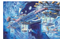
「宇宙コロニー」