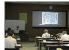
宮崎県立図書館 イベント 検索