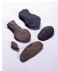
擦切有溝石磨石と打製土掘具 (胼穴遺跡・黒土遺跡/都城市)

この交流展では、イネをはじめとした穀物栽培の始まりを九州の考古資料から探り、よく似た地勢を持つ台湾の農耕とも比較しながら、狩猟採集社会から農耕社会への歴史的变化を考えます。