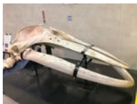
ザトウクジラの骨格標本