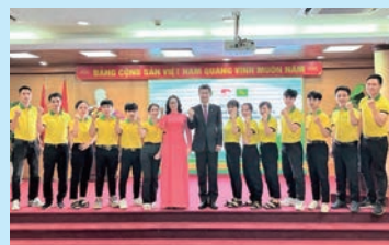
ベトナム国立農業大学のラン学長(中央)と宮崎クラス13名の生徒たち

国家間や地域間の人材確保競争が展開する中、より一層良好な受け入れ環境を整えるとともに、さらに交流を深め、温暖な気候や食・観光など本県の魅力をベトナムの方々