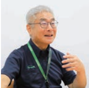
みやざき森林経営管理支援センター

手入れの行き届いていない森林について、市町村が仲介役となり、森林所有者と林業経営者をつなぐ「森林経営管理制度」。この制度の中心的役割を担う市町村への支援を実施する「みやざき森林経営管理支援センター」を設置・運営しています。