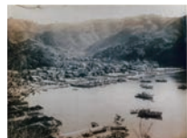
昭和20年頃の漁村風景 (北浦町市振地区)