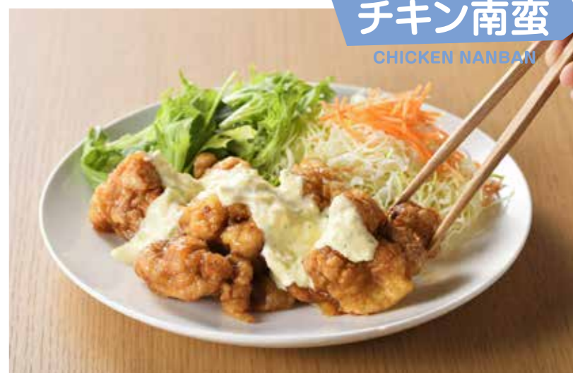
なんぼん チキン南蛮 CHICKEN NAMBAN