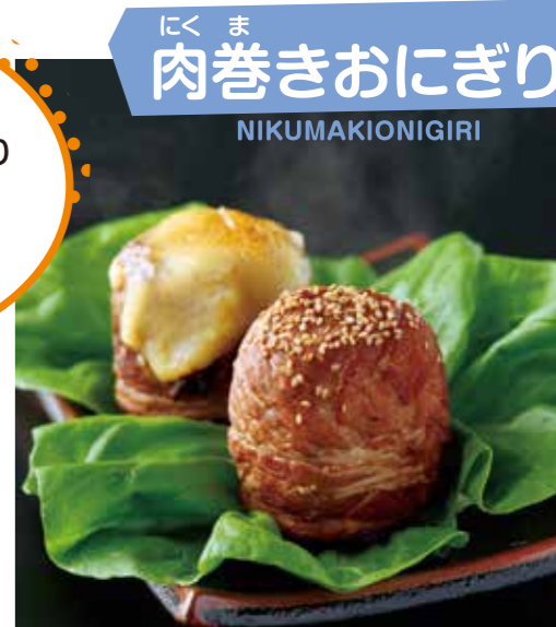
にくま 肉巻きおにぎり NIKUMAKIONIGIRI