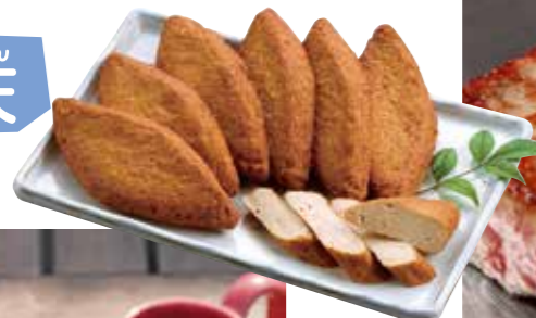
てん おび天 OBITEN