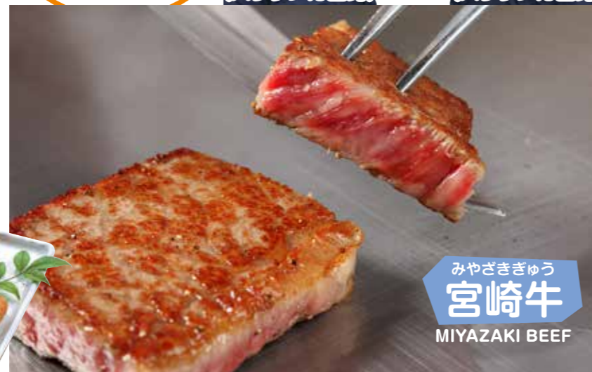
みやざきぎゅう 宮崎牛 MIYAZAKI BEEF