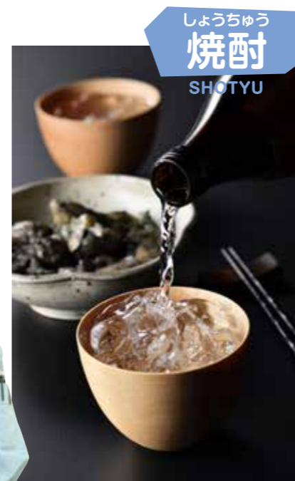
しょうちゅう 焼酎 SHOTYU