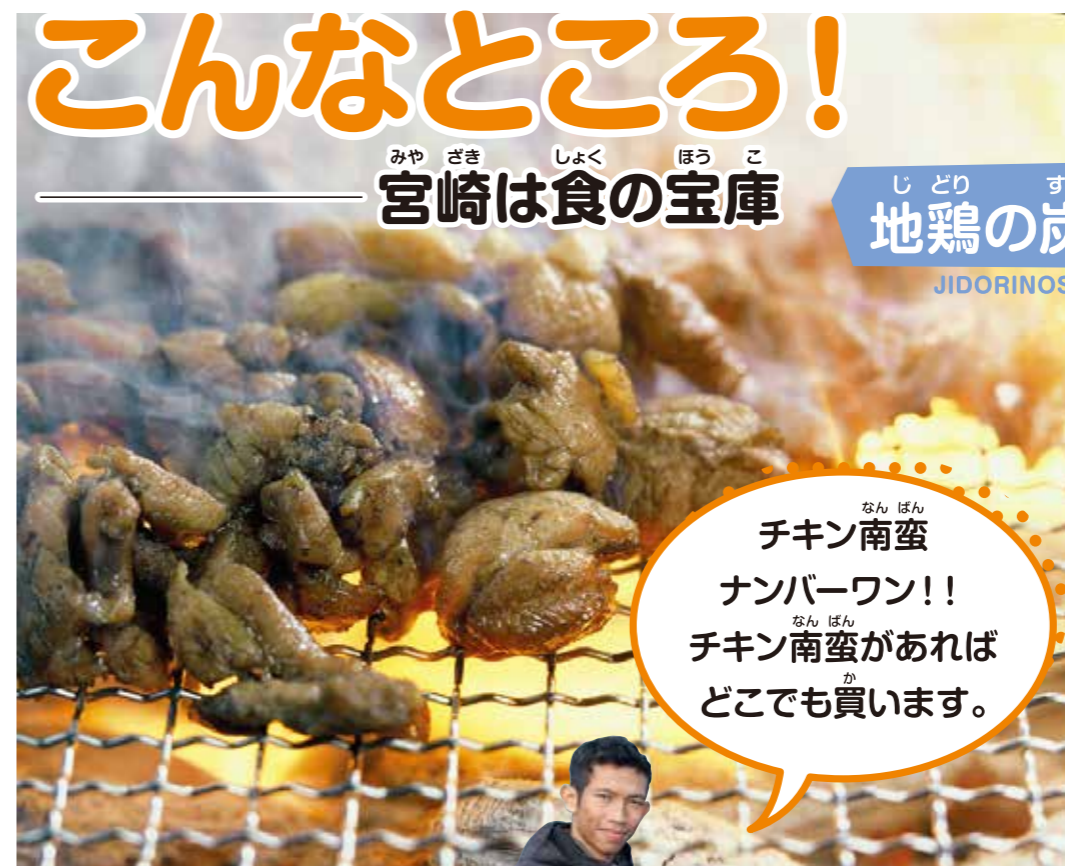
みやざき しょく ほうこ 宮崎は食の宝庫