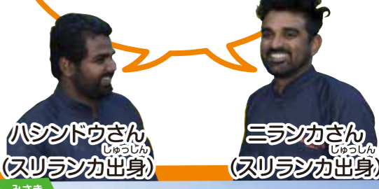
ハシンドウさん (スリランカ出身)

と い み さ き さ い しょ 都井岬は最初に い 行きました。 ひ じ ゅ う が う ま が せ す 日向の馬ヶ背が好き! なん かい い 何回も行きました。