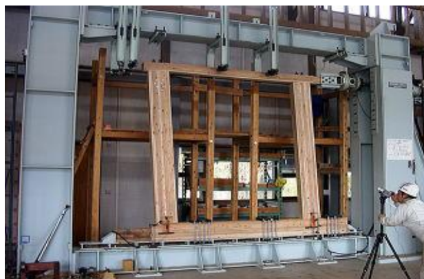
▲構造試験機木構造相談室

また、一般住宅の構法開発や性能評価の取り組み、スギ材の特徴を活かした新たな接合部や耐力壁の提案を行っています。