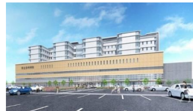
▲県立宮崎病院 (宮崎市)