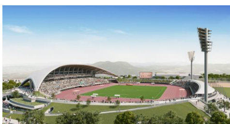
<陸上競技場 外観イメージ>