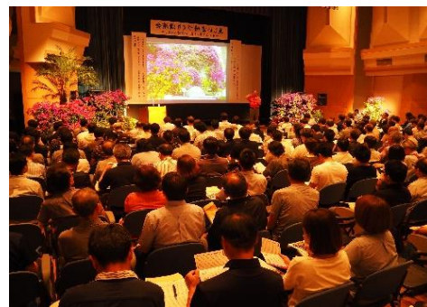
▲研修会「美しい宮崎づくりのつどい」

自然環境と共生する都市の実現を目指して、広域的観点から都市づくりの基本的な方針となる都市計画区域マスタープランを策定するとともに、市町村とともに将来の都市の姿を描いています。