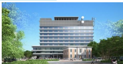
▲県防災庁舎 (宮崎市)

庁舎や県立学校などの県有建物の新築、増改築、改修等に関連する調査や設計、工事監理等を行っています。