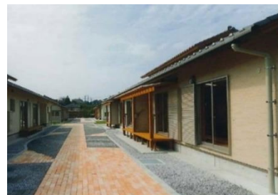
▶県営ひかりヶ丘 C 団地 (木造、子育て世帯向け)