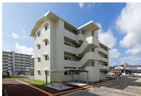
▲県営馬越団地 (学童保育施設併設団地)