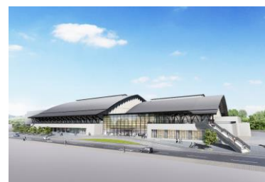
<体育館 外観イメージ>