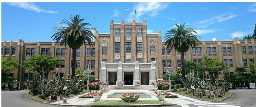
宮崎県庁本館 (1932年竣工)