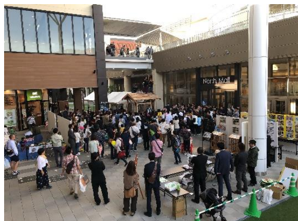
▲住情報イベント「住まい・る・メッセ」

宮崎県内には約 9,000 戸の県営住宅があり、「宮崎県営住宅長寿命化計画」により、老朽化した住宅の建替や、既存住宅のバリアフリー化、子育て世帯向け住宅整備など、安全・安心な住宅の整備を行っています。