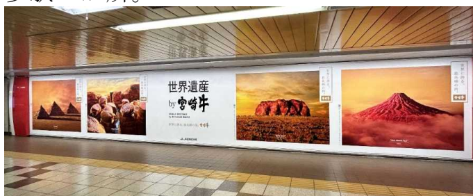
(ジャックのイメージ(新宿駅))

主要駅ジャックについては、4月14日(金)に投げ込み済み。 主要駅ジャックは、4月17日(月)～5月29日(月)のうち、概ね1週間をジャックする。広告場所は、東京5駅8か所、大阪17駅23か所、福岡博多駅8か所。