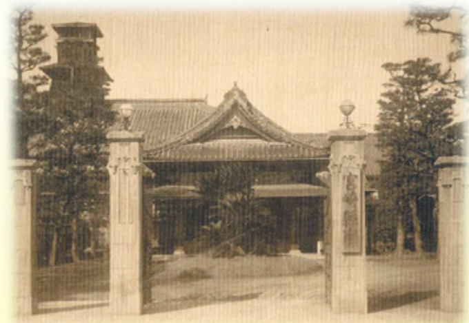
宮崎県再置当時の県庁舎