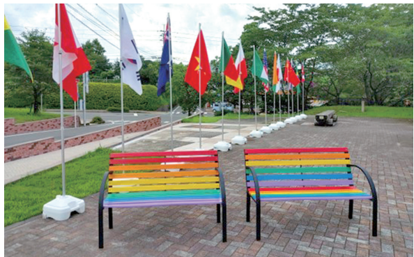
宮崎国際大学「プロジェクト 8.9」

※「8.9」は、日本の人口におけるLGBTの割合は8.9%であるという電通ダイバーシティの調査結果に基づきます。