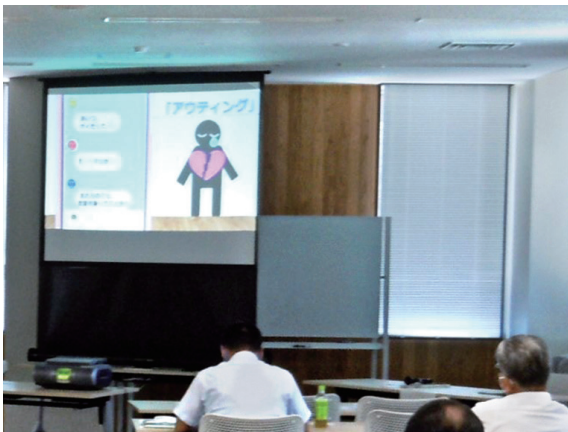
令和4年度県民人権講座「性の多様性と人権」

性的マイノリティの方々が暮らしやすい社会づくりのため、性の多様性について学ぶ講座やイベントの開催を通して、県民の皆様の理解促進の取り組みを進めています。