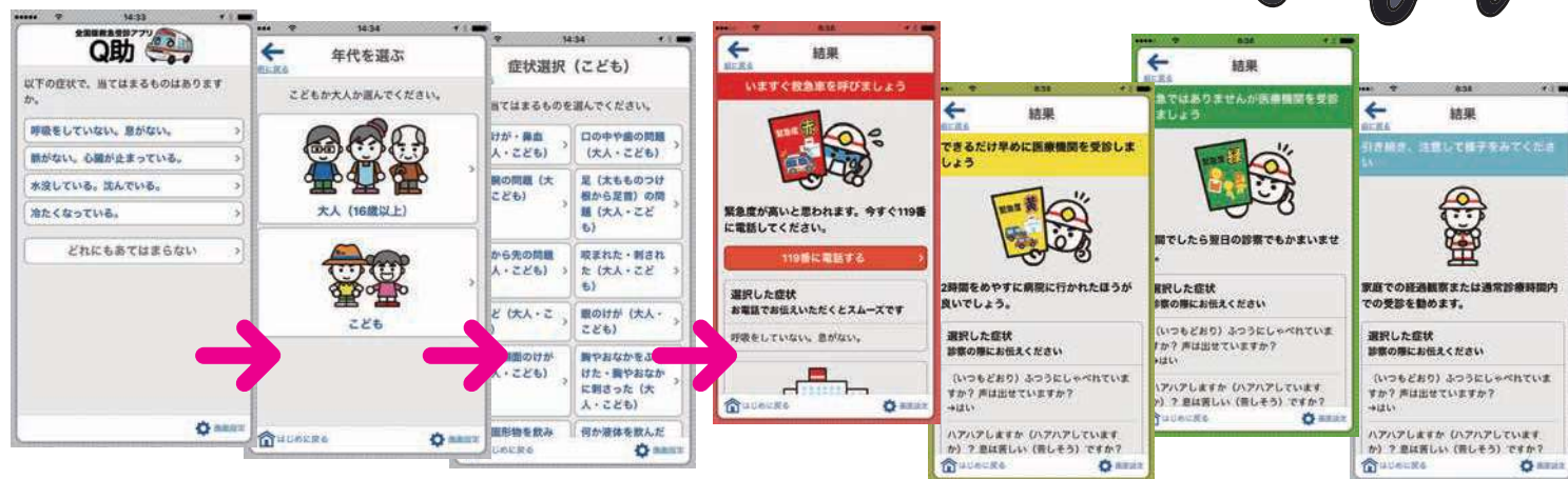
1 緊急度の高い 症状選択

その後、119番通報、医療機関の検索（厚生労働省の「医療情報ネット」にリンク）や、受診手段の検索（一般社団法人全国ハイヤー・タクシー連合会の「全国タクシーガイド」にリンク）を行うことができるようになっています。