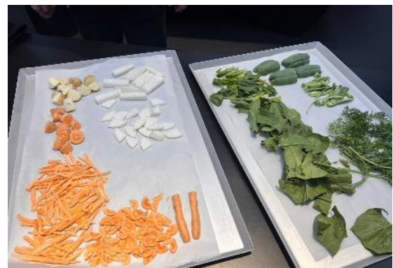
冷凍加工した野菜類 (テスト)