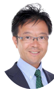
副会長 読谷山 洋司 (延岡市長)