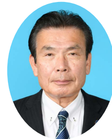
副会長 濱砂 守 (宮崎県議会議長)