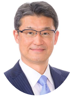
九州中央自動車道建設促進協議会 会長 宮崎県知事