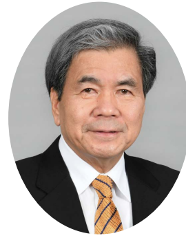
九州中央自動車道建設促進協議会 副会長 熊本県知事