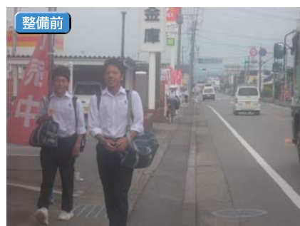
● 高鍋高岡線(西都市妻)

高齢者や障がい者などあらゆる人々が、安全で快適に通行できる歩行空間を提供するため、歩道を整備するとともに、道路のユニバーサルデザイン化を進めています。