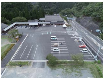
● 道の駅酒谷(日南市酒谷)