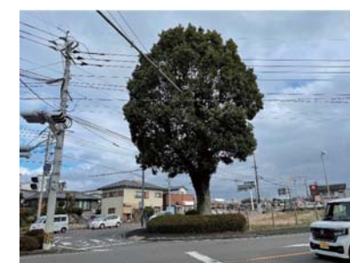
国道221号(小林市)クスノキ