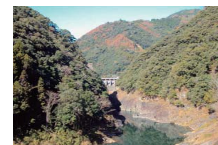
国道327号(諸塚村)溪谷美