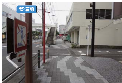
● 国道222号(日南市春日)

道路の防災性の向上、安全で快適な通行空間の確保、良好な景観の形成や観光振興の観点から無電柱化を進めています。