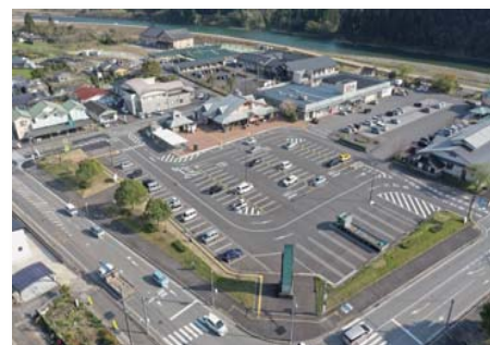
● 道の駅とうこう(日南市東郷町)

「道の駅」において、道路利用者や地域住民が利用しやすい環境整備や観光情報の提供等により、利用者のサービス向上に取り組んでいます。また、災害時の防災拠点としての機能拡充を進めています。