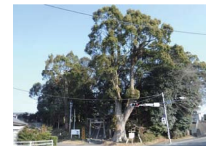
主要地方道 高鍋高岡線(西都市)クスノキ