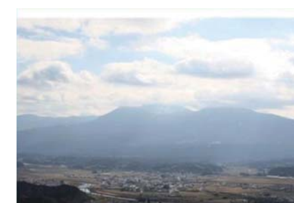
国道221号(えびの市)霧島連山眺望地