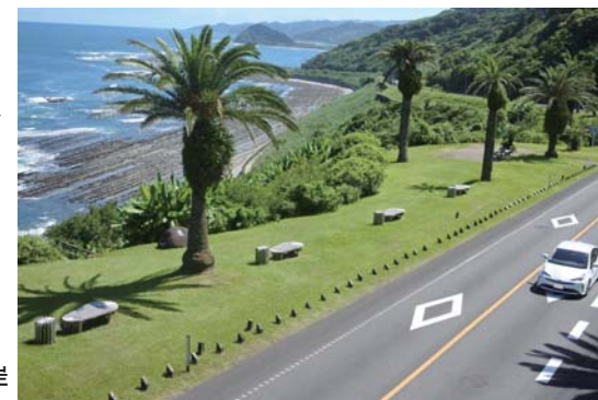
一般県道内海加江田線(旧国道220号 宮崎市)フェニックスほか

また、美しい郷土づくりを県民一丸となって推進していくために、平成29年4月に施行した「美しい宮崎づくり推進条例」においても、沿道修景美化の精神や取組はしっかりと引き継がれているとともに、中心的な施策の一つとして位置付けられています。