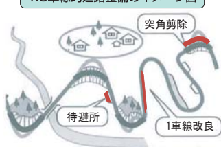
1.5車線の道路整備のイメージ図