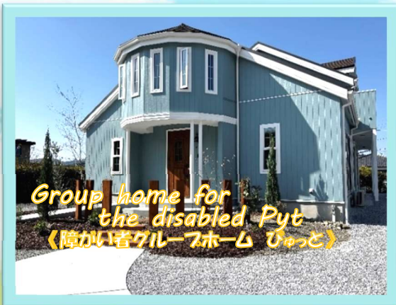
Group home for the disabled Pyt 《障がい者グループホーム ひょうと》

💡 明るく楽しい園生活・地域に根ざした施設づくりをモットーに施設全体で取り組んでいます。