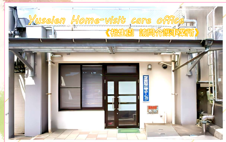
Yuseien Home-visit care office 《裕生園 訪問介護事業所》

💡 思いやりと優しさあふれるスタッフによるまごころもったサービスを提供し、明るく楽しい園生活を目指します。