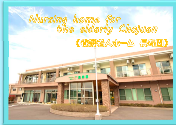
Nursing home for the elderly Chojuen 《介護老人ホーム 長寿園》

💡 デイサービス・ショートステイ・訪問介護を組み合わせサービス提供を行います。住み慣れた地域で365日生活継続支援サービスを受けることができます。