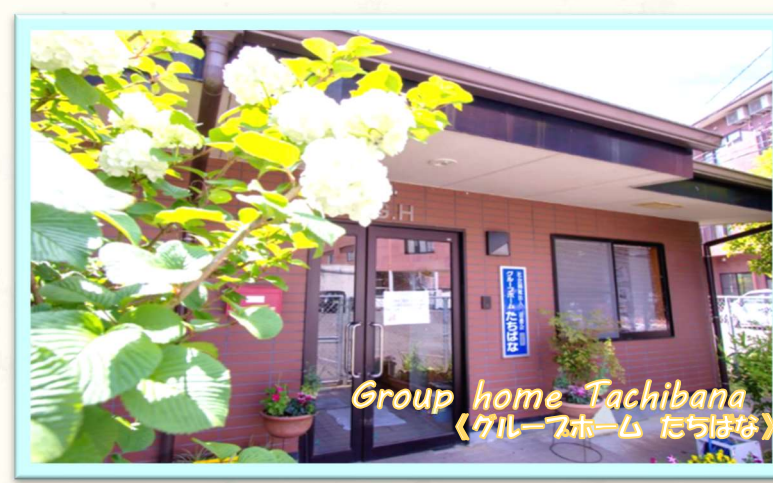
Group home Tachibana 《グループホーム たちはな》

💡 独立した生活を送ることに不安がある方、家庭環境や住宅事情により居宅での生活が困難な方に対してサービスを行います。