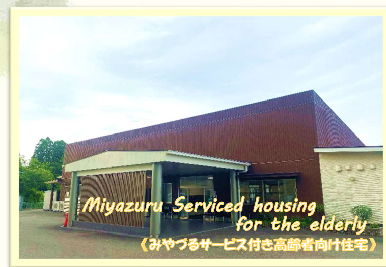
Miyazuru Serviced housing for the elderly 《みやづるサービス付き高齢者向け住宅》

💡 認知症のある高齢者が、家庭的な雰囲気の中、少人数の共同生活を送るホームです。