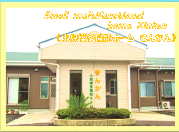
Small multifunctional home Kinkan 《小規模多機能ホーム きんかん》

☆登録定員:25名 ☆デイ:1日15名 ☆ショートステイ:9名 宮崎市に住所がある要介護認定を受けた方