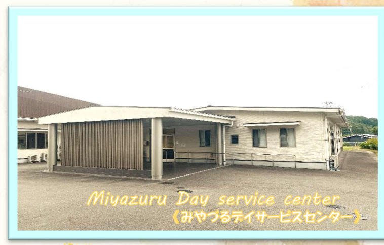
Miyazuru Day service center 《みやづるデイサービスセンター》

💡 家庭的な環境と地域住民との交流のもとで、これまでの暮らしを尊重し、個々にあったサービス提供が出来る住宅を目指します。