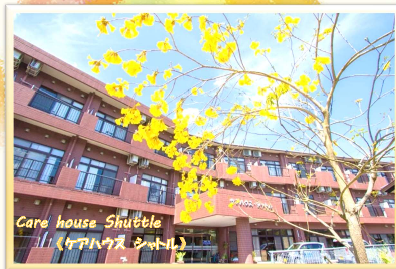
Care house Shuttle 《ケアハウス シュトル》