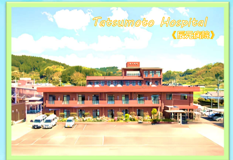
Tatsumoto Hospital 《辰元病院》