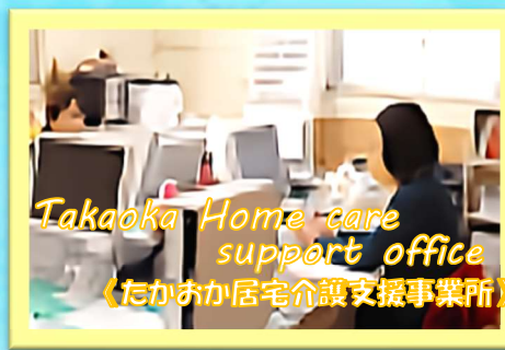
Takaoka Home care support office 《たかおか居宅介護支援事業所》

💡 ムーミンハウスがコンセプトのグループホーム。個性を互いに認め合い自分らしい豊かな毎日を送る為のお手伝いをします。