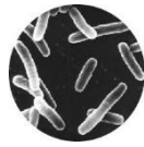
大きさ： 数マイクロメートル

A. レジオネラ属菌は、土の中や池、沼、水たまりなど 自然環境中のどこにもいる細菌 です。増殖に適した温度は 36℃前後 (20～45℃)で、入浴施設などで増殖しやすいことが知られています。