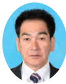
委員 あらがみ みのる 荒神 稔 宮崎県議会自由民主党 都城市選出