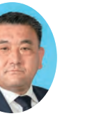
委員 やました ひろみ 山下 博三 宮崎県議会自由民主党 都城市選出