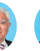
委員 ふたみ やすゆき 二見 康之 宮崎県議会自由民主党 都城市選出