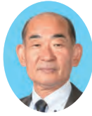
委員 ごとう てつろう 後藤 哲朗 宮崎県議会自由民主党 延岡市選出