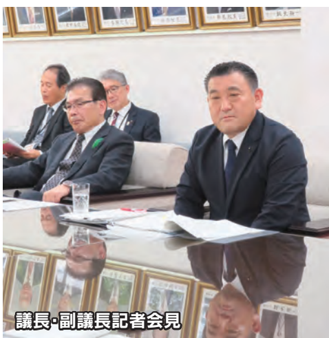
議長・副議長記者会見