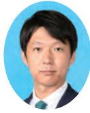
副委員長 やまぐち としき 山口 俊樹 宮崎県議会自由民主党 宮崎市選出