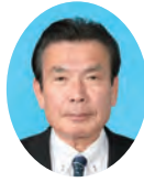
委員 はますな まもる 濱砂 守 宮崎県議会自由民主党 西都市・西米良村選出