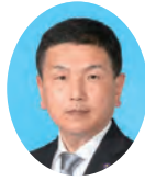
委員 さかもと やすろう 坂本 康郎 公明党宮崎県議団 宮崎市選出