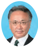
委員長 ひだか としお 白高 利夫 宮崎県議会自由民主党 東諸県郡選出