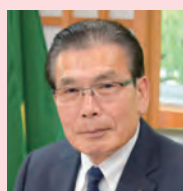
議長 はますな まもる 守 濱 宮崎県議会自由民主党 西都市・西米良村選出

本県におきましては、コロナの影響や物価高騰、急速に進行する少子高齢化とそれに伴う人口減少によって生じる人手不足など、経済はもとより地域社会の活力も低下するなど依然として厳しい状況が続いております。