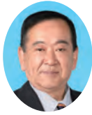
委員長 かわそえ ひろし 川添 博 宮崎県議会自由民主党 宮崎市選出