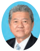
委員 とやま まもる 外山 衛 宮崎県議会自由民主党 日南市選出