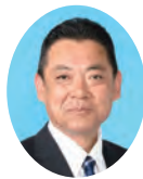
委員 ひだか ひろゆき 日高 博之 宮崎県議会自由民主党 日向市選出