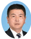
副委員長 さかもと やすろう 坂本 康郎 公明党宮崎県議団 宮崎市選出