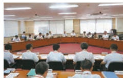
昨年度の特別委員会 (人口減少・地域活性化対策)

委員会には、常時設置されている「常任委員会」と「議会運営委員会」、必要ときに設置する「特別委員会」があります。各委員会では、調査事項に関する現状や課題、先進的な取組等を調査するために、県内外での現地調査も行っています。