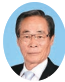
委員 やました ひろみ 山下 博三 宮崎県議会自由民主党 都城市選出