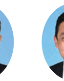
委員 ひだか ひろゆき 日高 博之 宮崎県議会自由民主党 日向市選出