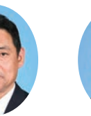
委員 ふたみ やすゆき 二見 康之 宮崎県議会自由民主党 都城市選出