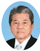
委員 とやま まもる 外山 衛 宮崎県議会自由民主党 日南市選出