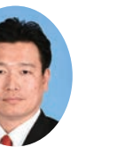
委員 ふつはら まさみ 逢原 正三 宮崎県議会自由民主党 北諸県郡選出