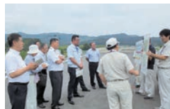
昨年度の商工建設常任委員会 現地視察(都城志布志道路)