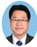
委員 みぎまつ たかひろ 右松 隆央 宮崎県議会自由民主党 宮崎市選出