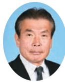
委員 はますな まもる 瀧砂 守 宮崎県議会自由民主党 西都市・西米良村選出