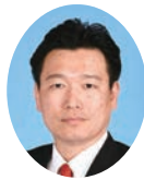
委員 ふたみ やすゆき 二見 康之 宮崎県議会自由民主党 都城市選出