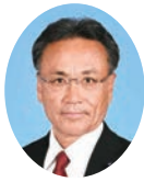
委員長 ひだか としお 日高 利夫 宮崎県議会自由民主党 東諸県郡選出