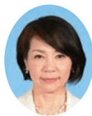
委員 わきたに のりこ 脇谷のりこ 宮崎県議会自由民主党 宮崎市選出