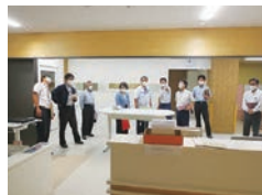
昨年度の厚生常任委員会 現地調査（県立宮崎病院）

委員会には、常時設置されている「常任委員会」と「議会運営委員会」、必要ときに設置する「特別委員会」があります。各委員会では、調査事項に関する現状や課題、先進的な取組等を調査するために、県内外での現地調査も行っています。