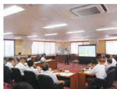
昨年度の特別委員会 （持続可能な地域づくり対策）