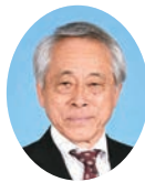
委員 ふつはら まさみ 逢原 正三 宮崎県議会自由民主党 北諸県郡選出