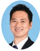
委員長 にしむら さとし 西村 賢 宮崎県議会自由民主党 日向市選出