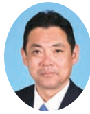
委員 ひだか ひろゆき 日高 博之 宮崎県議会自由民主党 日向市選出