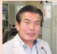
副議長 はますな まもる 濱砂守 宮崎県議会自由民主党 西都市・西米良村選出

今後とも、県民の皆様様の様々な声に真摯に耳を傾けながら、信頼され、期待される議会を目指すとともに、元気で活力ある郷土づくりに誠心誠意努めてまいりますので、二層の御理解と御協力をお願い申し上げます。