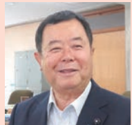
議長 なかの かずのり 中野一則 宮崎県議会自由民主党 えびの市選出

県議会では、県民の皆様が安全・安心で、心豊かに暮らすことができる社会を実現するため、行政に対する監視・評価、チェック等の機能を果たすとともに、積極的な政策提言を行うなど、執行部とともに県政運営に力を注いでおります。