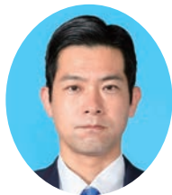
くどう たかひさ 工藤 隆久 公明党