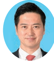
にしむら さとし 西村 賢 自由民主党