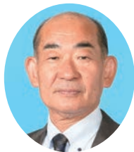
ごとう てつろう 後藤 哲朗 自由民主党