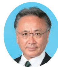
ひだか としお 日高 利夫 自由民主党