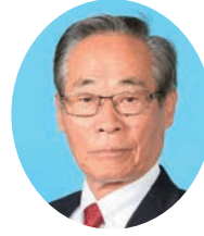
やました ひろみ 山下 博三 自由民主党