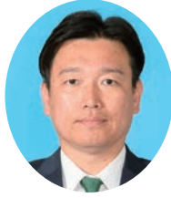
ふたみ やすゆき 二見 康之 自由民主党