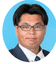
やまうち 山内 いつとく 自由民主党