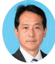
まるやま ゆうじろう 丸山 裕次郎 自由民主党