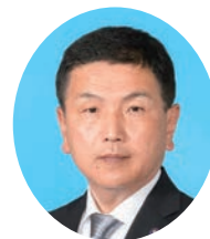
さかもと やすろう 坂本 康郎 公明党