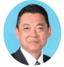
ひだか ひろゆき 日高 博之 自由民主党