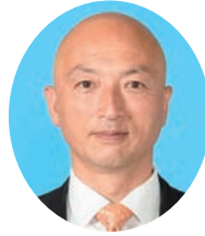
ひだか よういち 日高 陽一 自由民主党