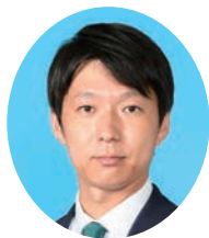
やまぐち としき 山口 俊樹 自由民主党