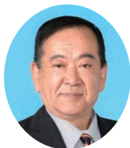
かわそえ ひろし 川添 博 自由民主党