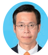
いむら みつお 今村 光雄 公明党