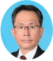
しげまつ こうじろう 重松 幸次郎 公明党