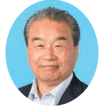
いもと ひでお 井本 英雄 自由民主党