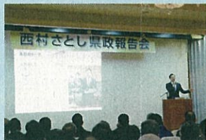
前回の県政報告会の様子

令和2年度は、監査委員として県の監査を行ってまいりました。県庁各課や学校など教育機関、各出先事務所、また県が出資や委託事業を行う民間企業や団体なども訪問して監査を行いました。コロナ禍の影響で県福岡事務所の監査をオンラインで行い、一部予定先の監査が中止となる影響もありました。監査は、詳細な事業報告書の読み込みや聞き取りの準備に苦勞しましたが、とても勉強となりました。この経験を今後の政治活動にも生かしてまいります。 ※監査委員は知事等から独立した機関で、県の予算が法令などに従って執行されているか、経済的・効率的に執行されているか、事務事業が効果的であるかといった観点で監査し、その結果を公表します。指摘等は、その後の事業の改善などに生かされていきます。監査委員定数は4人(議員はうち2名)