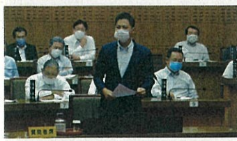
6月議会：アクリル板未設置

感染防止も経済再生も県民の協力無しでは 叶いません。この機に、これからの宮崎県が どうあるべきか共に考え、行動していきま しょう。皆様方からのご意見ご提案よろしく お願い申し上げます。