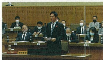
11月議会：アクリル板設置済