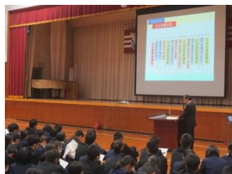
【県議会の仕組み等の説明】