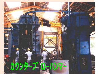
カウンターブローハンマー