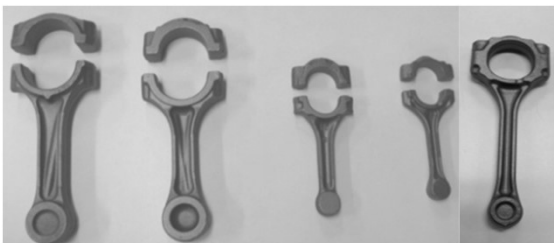
コンロッド (自動車エンジン部品)