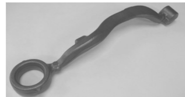
アームサスペンション (自動車足回り部品)