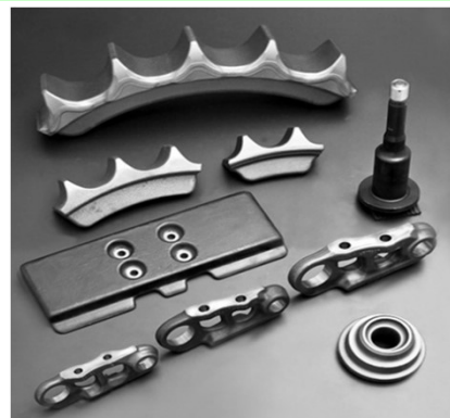
建設機械 足回り部品