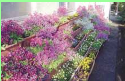
昨年度、「緑の募金」を活用して整備した高千穂小学校の花壇