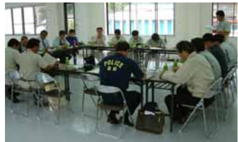
災害危険箇所点検後に行った検討会(日之影町)