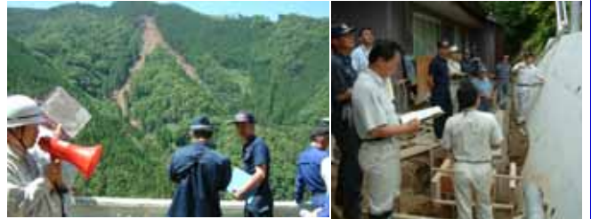
災害危険箇所点検(高千穂町)

今年も、日之影町が6月2日に、高千穂町が6月13日に、五ヶ瀬町が6月14日に、関係機関(役場、警察署、消防団、支庁)の職員が参加し実施しました。