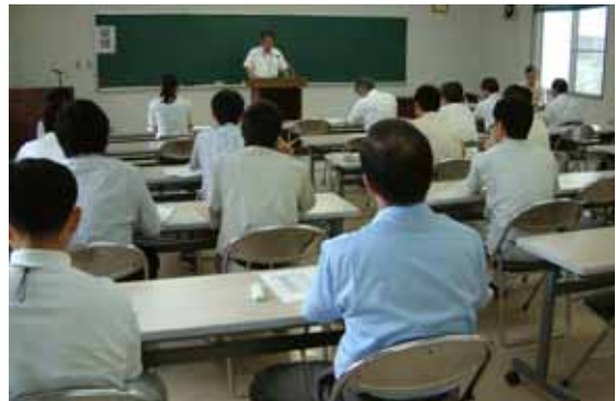
【業務内容研修】 西臼杵における生活の注意事項なども講義がありました。

会議室で各課からの業務内容の説明を受けた後、各課の現場において現地研修を行いました。