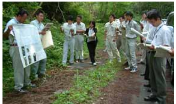
【現地研修】 中山間総合農地防災事業（水路トンネル）（五ヶ瀬町）