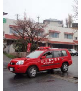
公用車による広報活動