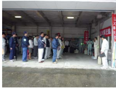
パレード出発式の様子

「見直そう 森の恵みと 火の始末」を統一標語に宮崎県林野火災予防運動（1月30日から2月5日まで）の一環として、2月3日に、管内の3町、森林組合、宮崎北部森林管理署、西臼杵支庁の担当職員21名（車12台）により3町に分かれて林野火災防止パレードを行いました。パレードでは、不注意な火の取り扱いにより山火事が発生し、私たちの生活を守っている大切な森林が失われないよう山火事防止の啓発を行いました。