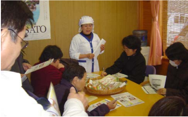
「村の果菓子屋」での研修の様子

今回の研修を通じて、参加者は農業生産規模の小さな中山間地域で企業的に農産物加工を実践する心構えや姿勢を学ぶことが出来たようです。