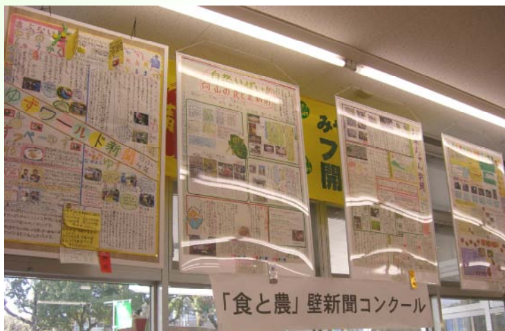
Aコープ高千穂店での展示状況