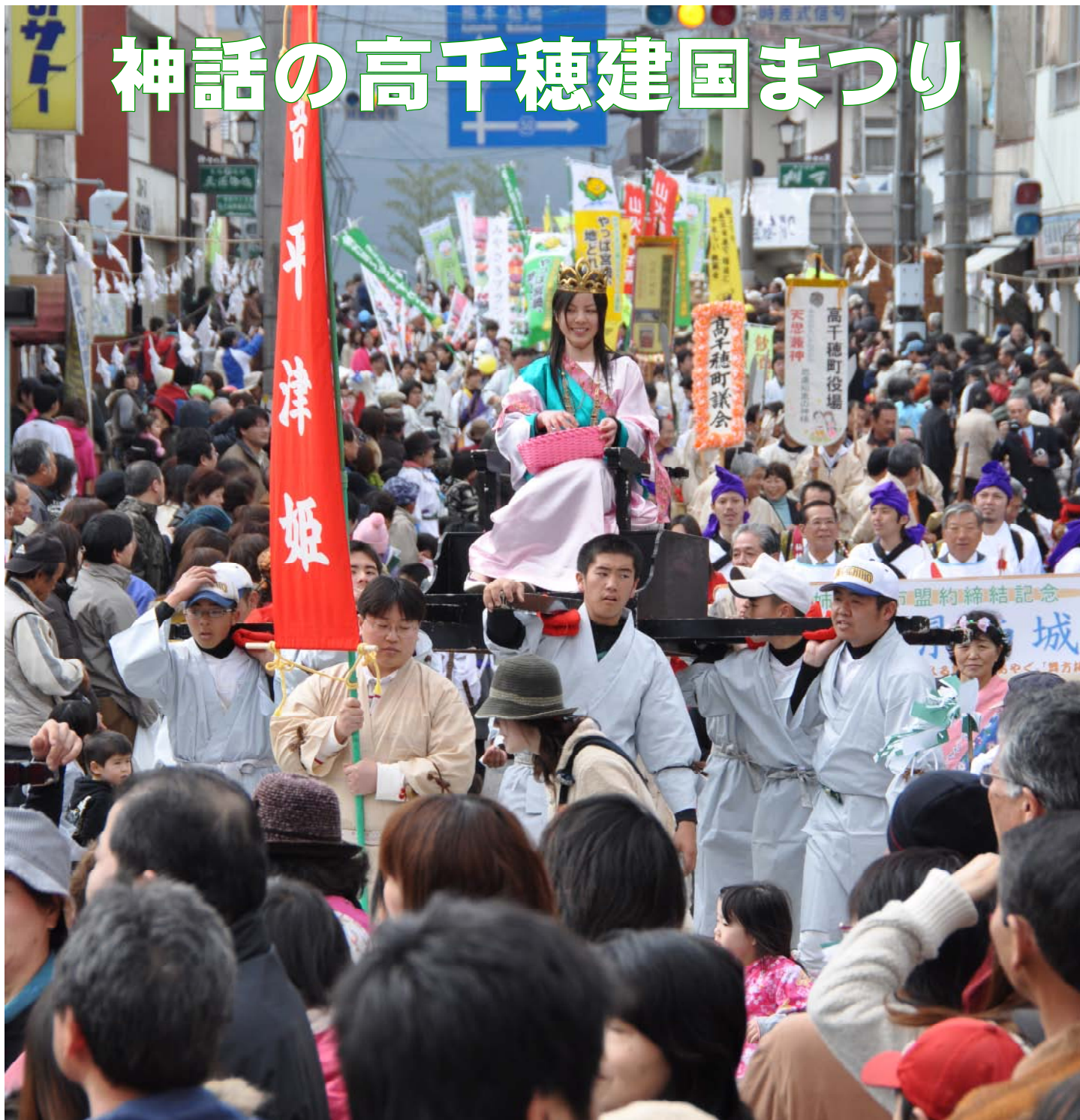
高千穂町市街で行われた八百万（やおよろず）の神々のパレード

第24回神話の高千穂建国まつりが2月11日に高千穂町市街で行われました。同祭は、建国記念の日に毎年開催されているもので、古代衣装を身にまとい八百万（やおよろず）の神々に扮した約550人が高千穂神社からくしふる神社までの約1.5kmを練り歩きました。沿道には多くの見物客が訪れ、神話絵巻を楽しみました。また、パレードの後には、ダンスの披露や約1,000人分のだご汁の振る舞いなどの催しもあり、賑わいました。