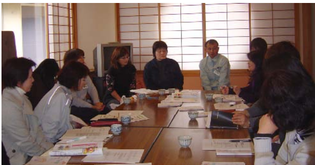
木城町農村女性指導士との交流

参加した農村女性指導士は「今回の視察研修を参考により良い活動をしていきたい」と意欲を示していました。