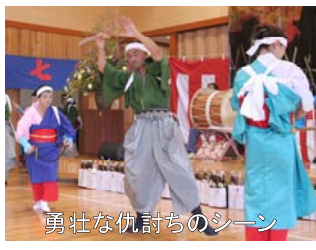
勇壮な仇討ちのシーン

地区に根付く文化を現在まで大切に保存継承されていることはとても素晴らしいことで、 地区の元気の源 にもなります。これからも 地区の宝 として 大切に受け継いで いただきたいおまつりです。