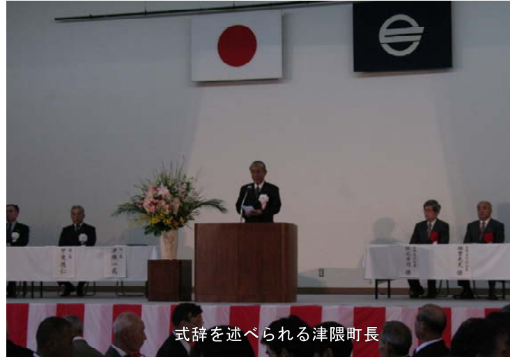
式辞を述べられる津隈町長