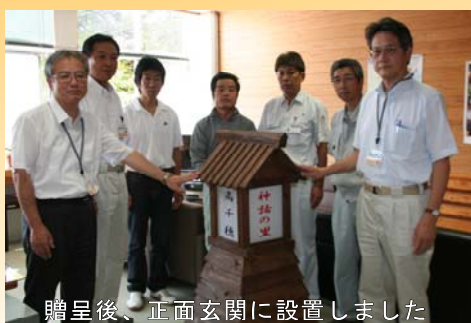
贈呈後、正面玄関に設置しました