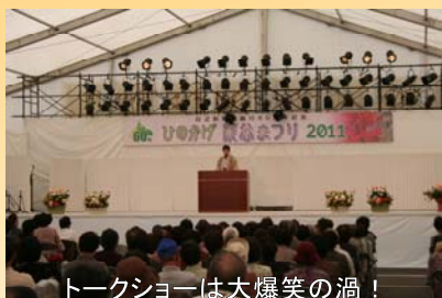
トークショーは大爆笑の渦！

10月22日から23日にかけて、日之影町の癒しの森運動公園で「ひのかげ溪谷まつり2011」が盛大に開催されました。