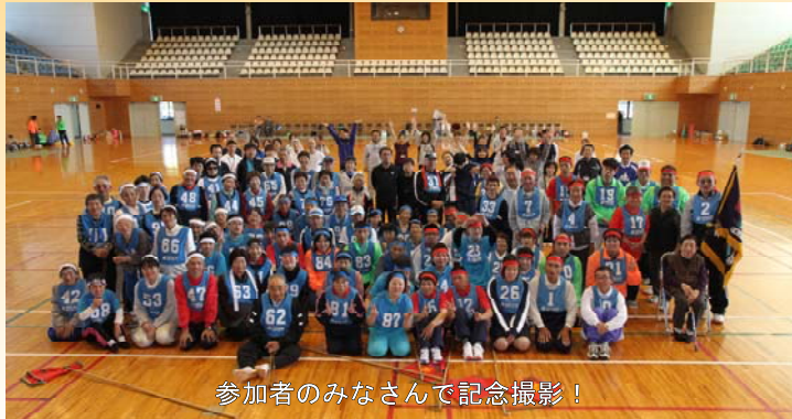
参加者のみなさんと記念撮影！

今年で7回目を迎えるこの大会は、西臼杵郡障がい者スポーツ大会実行委員会と各町役場が中心となった手作りの大会です。今年から精神に障がいのある方も加わり、郡内から99名（高千穂町65名、日之影町21名、五ヶ瀬町13名）の参加者が、スポーツを通して障がいの区分や世代を超えて交流を深められました。