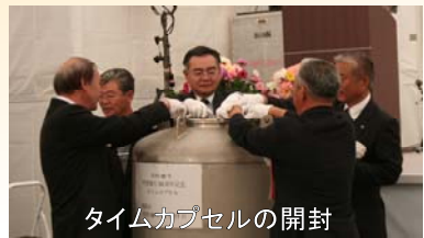
タイムカプセルの開封