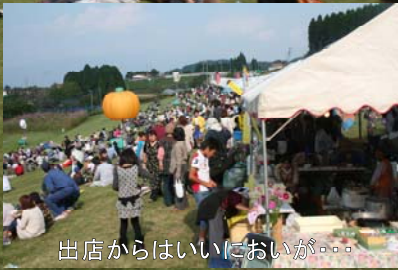
出店からはいいにおいが...