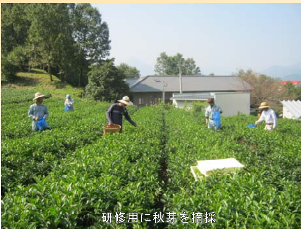
研修用に秋芽を摘採

西臼杵地区烏龍茶研究会では、烏龍茶が西臼杵特産である釜炒り茶の製法と共通部分が多いことから、一昨年から烏龍茶の産地化を目指し取り組んでいます。今回の研修で大きく前進したものと思われます。