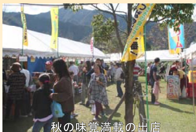
秋の味覚満載の出店

今回は 町制施行60周年 となるのですが、総合開会式の最後に、 30年前に埋めたタイムカプセルが開封され、当時を忍ばせる品々 が取り出され披露されました。その中にあった当時の町長さんが書