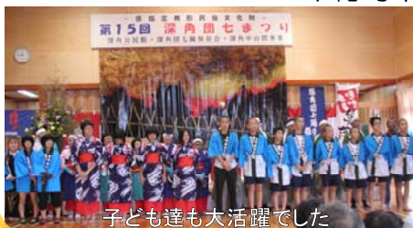
子ども達も大活躍でした