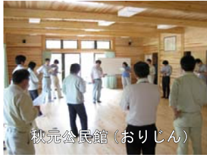
秋元公民館 (おりじん)