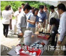
JA 高千穂地区中川茶工場