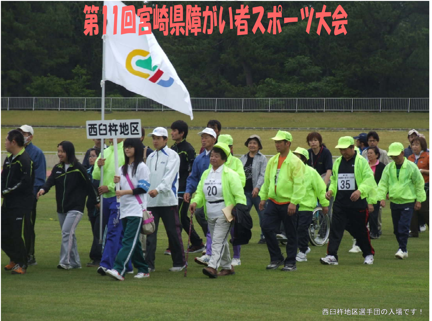
西臼杵地区選手団の入場です！

5月13日(日)、宮崎県総合運動公園(宮崎市)で第11回宮崎県障がい者スポーツ大会が開催されました。