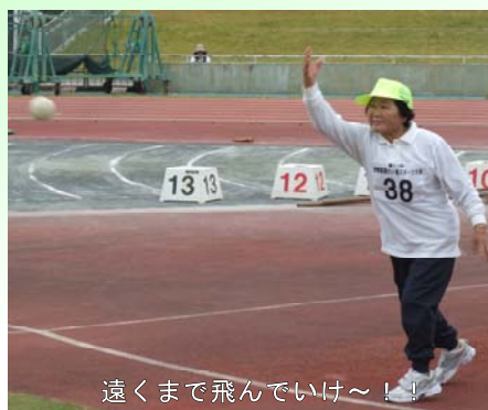
遠くまで飛んでいけ〜!!!