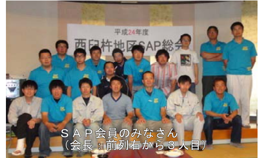
SAP会員のみなさん (会長：前列右から3人目)

特に、今年度は宮崎県SAP発足50周年の節目の年であり、11月には記念式典（7日）やイベント（23日）が計画されており、活動が充実したものになるよう、会員一丸となって頑張っていくと決意を新たにしました。