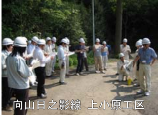
向山日之影線 上小原工区