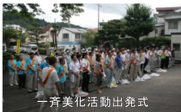
一斉美化活動出発式

宮崎県は、毎年7月を「河川愛護月間」、8月を「道路ふれあい月間」として、河川及び道路の愛護活動の推進や正しい利用の啓発を目的に、各種の取組を行っています。この取組の一環として、西臼杵支庁では、8月6日に西臼杵管内の各機関・団体の方々約350名で河川・道路一斉美化活動を実施しました。