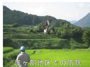
浅ヶ部地区での防除

今回の試験散布により、来年以降も希望者が増加することが予想されるため、 西臼杵地区の無人ヘリ防除協議会の設立とオペレーターの早期育成を進めるため、関係機関と連携を進めていくこと にしています。