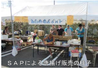
SAPによる唐揚げ販売の様子

JA青年部各支部、女性部、商工会青年部、食と農を考える県民会議西臼杵支部、西臼杵地区SAPが出店し、農業改良普及センターが事務局を持つSAPでは、鶏の唐揚げ(コズ胡椒添え)を販売しました。