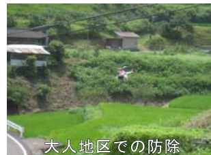
大人地区での防除