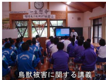
鳥獣被害に関する講義

鳥獣被害は地元の大きな課題 ということもあり、多くの質問が出るなど、生徒のみなさんは大変熱心に受講してくれました。今回、初めての試みでしたが、生徒のみなさんを通して地域の方々にも鳥獣被害防止の取組への理解が深まるよう期待しています。