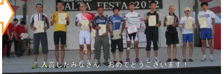
入賞したみなさん おめでとうございます！