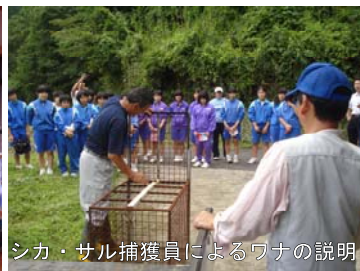
シカ・サル捕獲員によるワナの説明