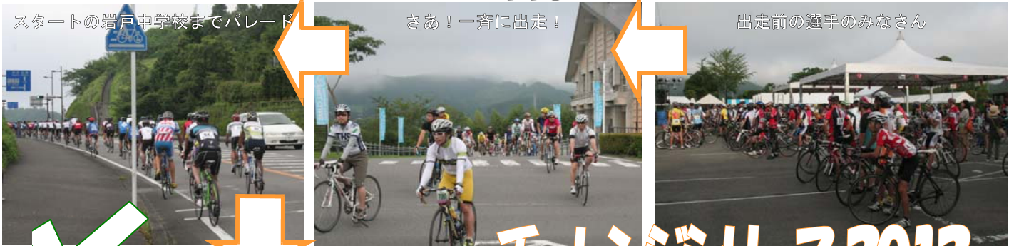
出走前の選手のみなさん