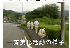
一斉美化活動の様子

こうした活動を通して、より多くの方に河川や道路を美しく安全に利用する「愛護の心」を広げていきたいと思えます。