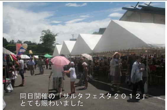
同日開催の「サルタフェスタ2012」 とても賑わいました

8月19日、高千穂町岩戸を舞台に、山間部の坂道を駆け上る自転車レース「 ヒルクライムチャレンジシリーズ2012高千穂天岩戸プレ大会 」が県内で初めて開催されました。