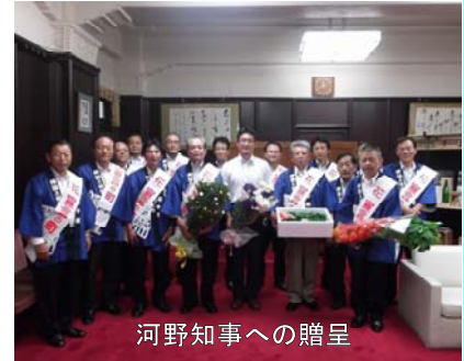
河野知事への贈呈

高千穂町では花に彩られた住みよい町づくりと花き生産の推進を図るため、毎年8月7日を「花の日」としており、今回はその一環として町特産の花きにトマトなどの野菜を添えて贈呈しました。天候不順の中、生産者の努力により美しく咲いた花に、知事も大変感激した様子でした。