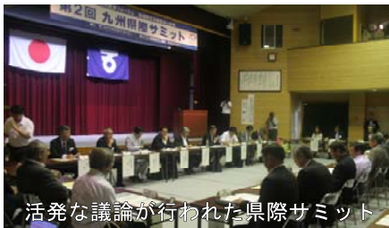
活発な議論が行われた県際サミット

8月21日、五ヶ瀬町町民センターにおいて、県際地域の様々な課題を解決することを目的に、県内外の自治体や経済界の関係者約120名が参加し、 第2回九州県際サミット が開催されました。