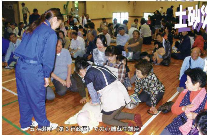
五ヶ瀬町（第3行政区）での心肺蘇生講座