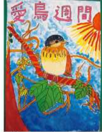
銀賞 甲斐 愛理 (宮水小5年)