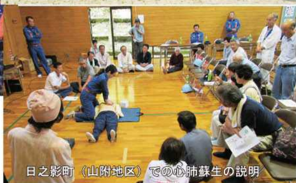
日之影町（山附地区）での心肺蘇生の説明