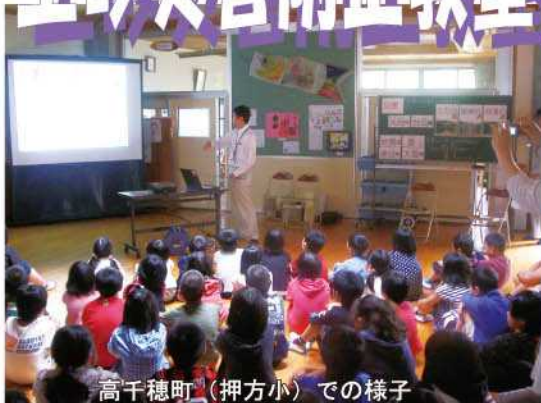
高千穂町（押方小）での様子