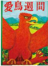
金賞 松本 潤樹 (三ヶ所中2年)