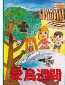
銀賞 相良 愛未 (高千穂小5年)