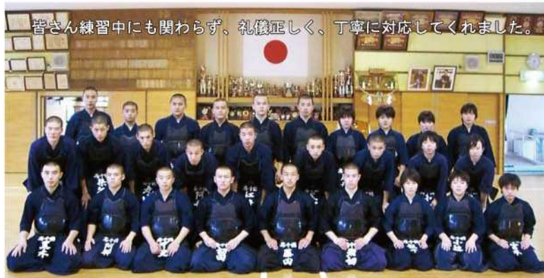
皆さん練習中にも関わらず、礼儀正しく、丁寧に対応してくれました。

高校総体、国体と続く全国大会での優勝を目指し、連日気迫あふれる猛練習を続けています。全国大会での御活躍をお祈りします！