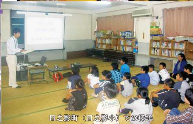
日之影町（日之影小）での様子

6月1日（高千穂町、日之影町）、及び6月22日（五ヶ瀬町）に土砂災害・全国統一防災訓練を実施しました。この訓練は、6月の土砂災害防止月間の一環として、全国の各市町村で実施するもので、地域住民、自衛隊、警察、県及び町の職員等が参加しました。