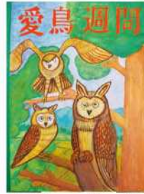
銅賞 工藤 魁人 (日之影中2年)