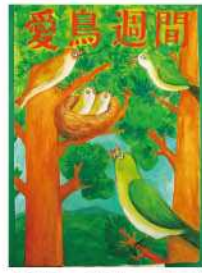
銀賞 岩本 凜誠 (日之影中2年)