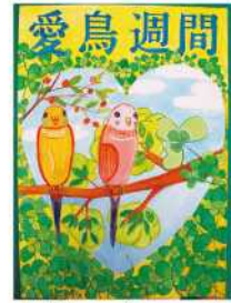
銅賞 田中 二千佳 (日之影中2年)