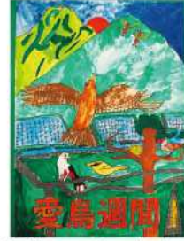
銅賞 戸高 太貴 (八戸小4年)