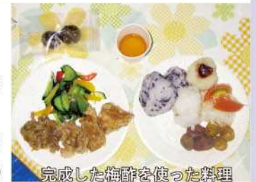
完成した梅酢を使った料理