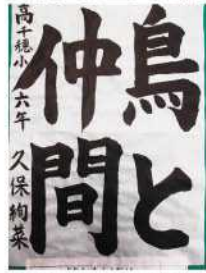
金賞 久保 絢菜 (高千穂小6年)