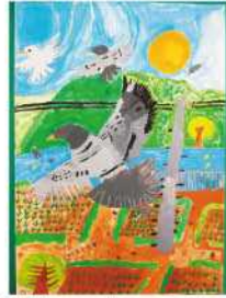
銅賞 戸高 心釉 (八戸小3年)