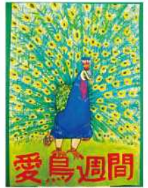
銅賞 那須 椋太 (三ヶ所中2年)