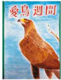
銀賞 中村 ひかり (高千穂高校1年)