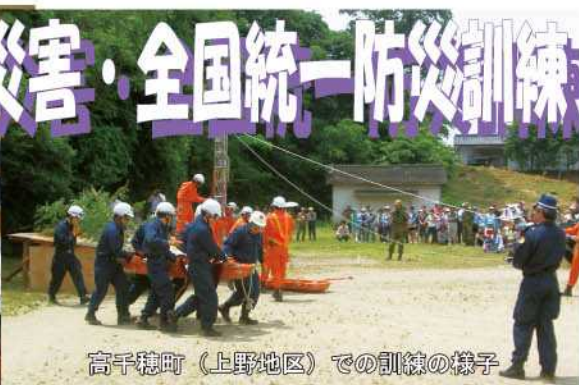
高千穂町（上野地区）での訓練の様子