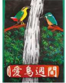
銅賞 安在 健壘 (高千穂小6年)