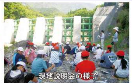
現地説明会の様子

説明会では、砂防ダム建設の契機となった平成19年発生 of 土石流被害の状況や砂防ダムの効果などについて説明を行ったあと、高さ11.5mの砂防ダムの間近まで近づき、その大きさなどから土石流の怖さを感じてもらいました。参加児童からは、「砂防ダムの役割が分かった」、「土石流災害から守るために砂防ダムができて良かった」といった感想が聞かれました。西臼杵地区は、急峻な山が多く土石流の危険が高い地域ですので、今後もこのような機会を通じて、さらなる防災意識の醸成に努めていきたいと考えています。