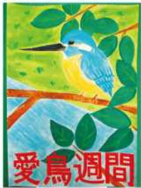
金賞 甲斐 穂乃佳 (高千穂高校1年)