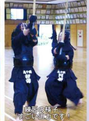
練習の様子。すごい迫力です！