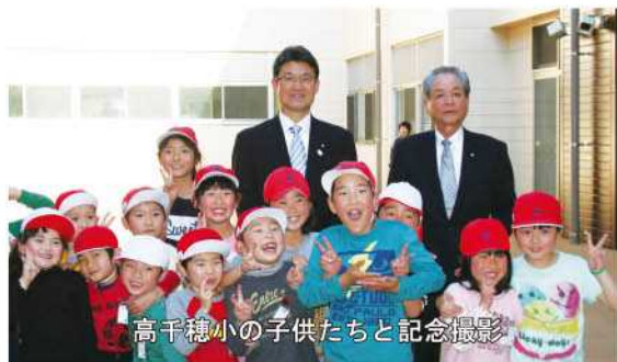
高千穂小の子供たちと記念撮影