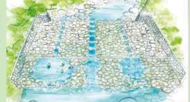
河川プール(完成予想図)