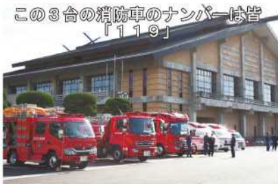
この3台の消防車のナンバーは皆「119」