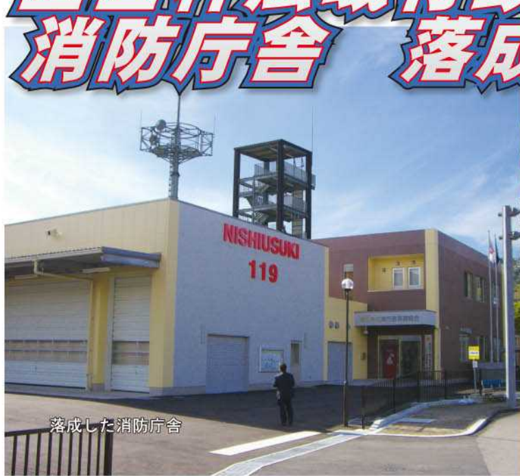
落成した消防庁舎