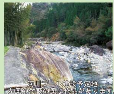
河川プール建設予定地 左奥の竹藪の奥に作品があります。