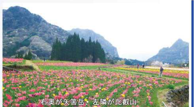
右奥が矢筈岳、左隣が比叡山

4月5日、日之影町中川地区で、恒例のチューリップまつりが開かれました。稲刈りを終えた棚田（25a）に地元総出で植え付けた約3万本のチューリップが国の名勝にも指定されている比叡山、矢筈岳を背景に、色とりどりの美しい花を咲せ、同時に植えられた菜の花や、山桜とともに多くの観光客を楽しませていました。また、地元の方たちによる田舎うどんやぜんざい、梅干し、煮しめ等の販売も行われていました。