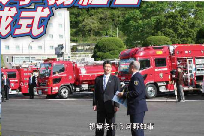
視察を行う河野知事