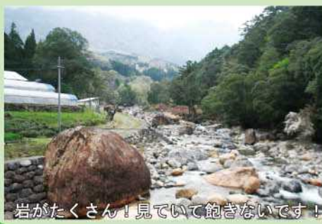
岩がたくさん！見ていて飽きないです！