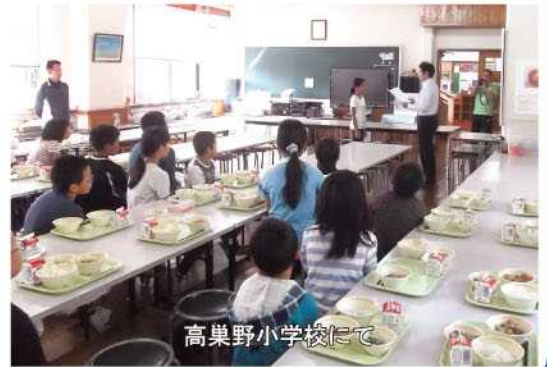
高巣野小学校にて

児童生徒の皆さんには、これからも、身近な野鳥を大切に守り育てていく気持ちを育てていただきたいと思います。