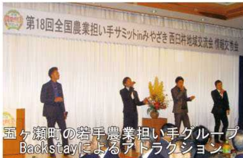
五ヶ瀬町の若手農業担い手グループ Backstay!によるアトラクション