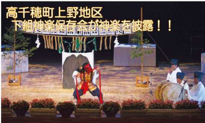
高千穂町上野地区 下組神楽保存会が神楽を披露！！