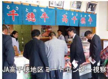
JA高千穂地区ミートセンター視察