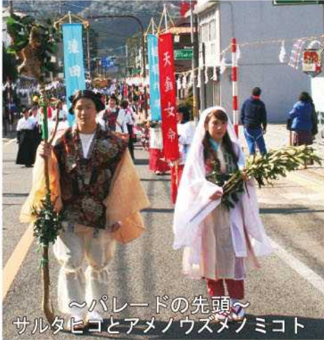
～パレードの先頭～ サルタビコとアメノウズメノミコト