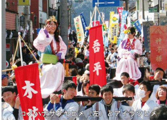
コノハナサクヤヒメ（左）とアイラツヒメ

2月11日、高千穂町中心部で「第31回神話の高千穂建国まつり」が開催されました。メインイベントの「神様パレード」には、女神様や神様をはじめ、古代衣装を着た約750人の町民の皆さんが、5台のみこしとともに行進し、6千人の観客を魅了しました。