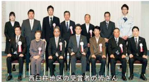
西臼杵地区の受賞者の皆さん