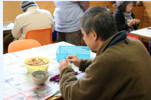
△勾玉を製作する様子