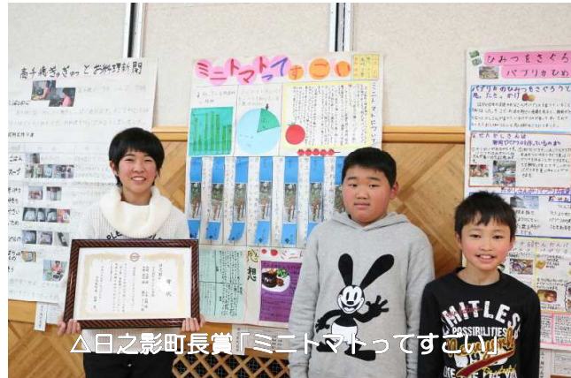
△日之影町長賞「ミニマップってすごい」