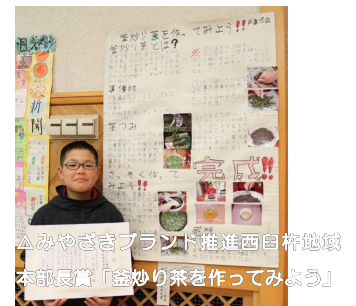
△みやざきブランド推進西臼杵地域本部賞「釜炒り茶を作ってみよう」