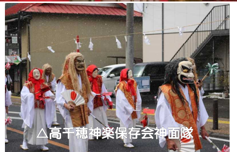
△高千穂神楽保存会神面隊

また、約1500人分の名物だご汁が振る舞われ、観光客や参加者が列を作りました。建国まつりは今年で第32回目を迎え、高千穂町の冬の一大イベントになっています。