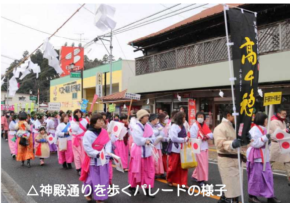
△神殿通りを歩くパレードの様子