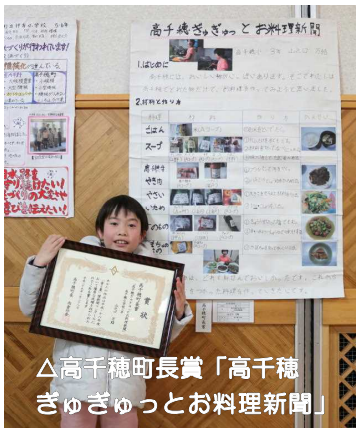
△高千穂町長賞「高千穂ぎゅぎゅっとお料理新聞」

金賞に輝いた、日之影小学校5・6年生の作品「『一步』野菜新聞」は、育てた野菜の紹介や成長記録、さらに自ら収穫した野菜を使ってカレーを作って食べるところまでを写真などを使って、分かりやすくまとめた作品になっています。