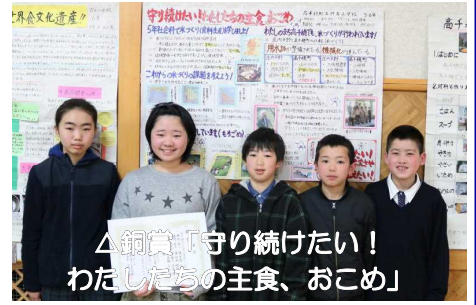
△銅賞「守り続けたい! わたしたちの主食、おこめ」

金賞に輝いた、日之影小学校5・6年生の作品「『一步』野菜新聞」は、育てた野菜の紹介や成長記録、さらに自ら収穫した野菜を使ってカレーを作って食べるところまでを写真などを使って、分かりやすくまとめた作品になっています。