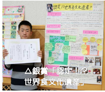
△銀賞「認定! 世界食文化遺産」