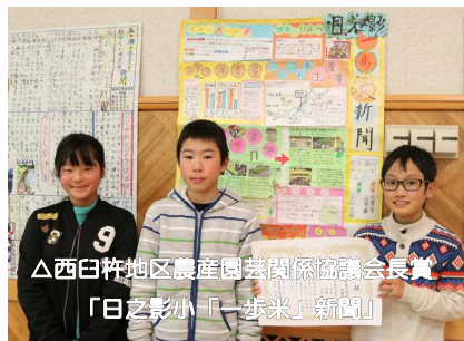
△西臼杵地区農産園芸関係協議会長賞「日之影小「一步米」新聞」