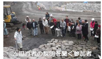
△担当者の説明を聞く参加者