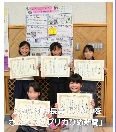
△五ヶ瀬町長賞「ひみつを さぐるパプリカひめ新聞」

その他の作品も、食べ物や農業に対する感謝や発見が上手にまとめられており、力作ぞろいでした。