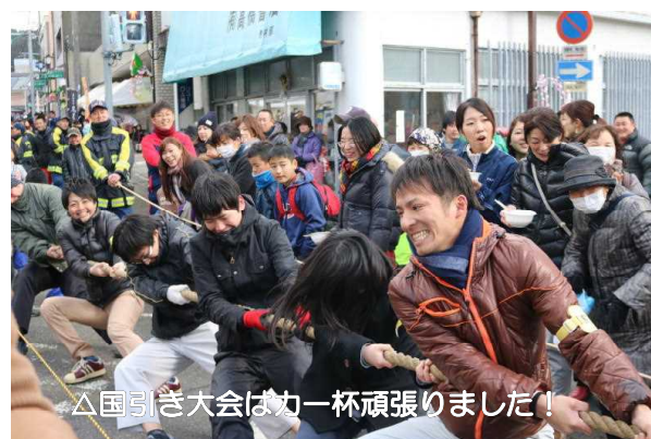
△国引き大会は一杯頑張りました!