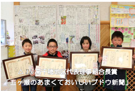
△JA高千穂地区代表理事組合長賞「五ヶ瀬のあまくておいしいブドウ新聞」

今後も、家庭や地域において「食と農」への関心を深められるよう、「食と農」壁新聞コンクールを充実させていきます。