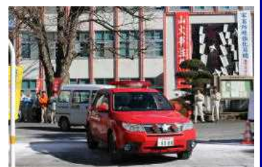
△呼びかけを行う車が出発

なお、西臼杵地区では昨年12月末までに2件の林野火災が発生しています。空気が乾燥する時期には、火の取扱いには十分注意し林野火災の予防にご協力をお願いします。