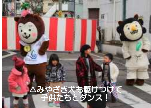
△みやさき犬も駆けつけて子供たちとダンス!