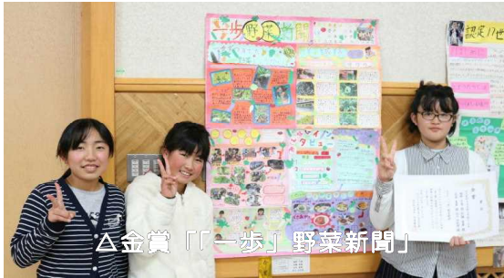
△金賞「『一步』野菜新聞」

みやざきの食と農を考える県民会議西臼杵支部では、管内の小学生に「食と農」に対する関心を深めてもらうため、毎年、壁新聞コンクールを実施しています。今年は24作品(93名)の応募があり、金賞を始め9作品が入選しました。