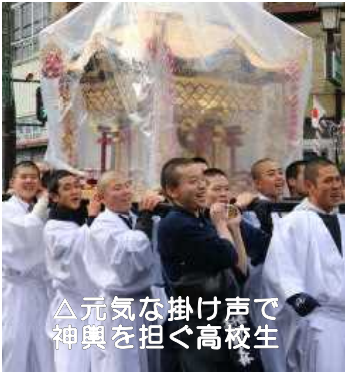
△元気な掛け声で神輿を担ぐ高校生

11日は前日のコンテストで選出された6名の神様役のほか、町内外からの参加者が古代衣装を身にまとい、高千穂神社からくしふる神社までの約1.5キロの距離をパレードに参加しました。雪の舞う中、威勢良くお神輿を担ぐ高校生など、参加者は元気に歩きました。