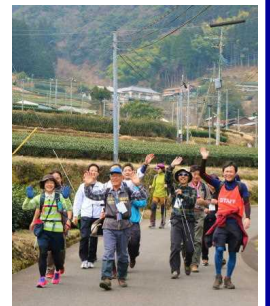
△オルレを歩く参加者