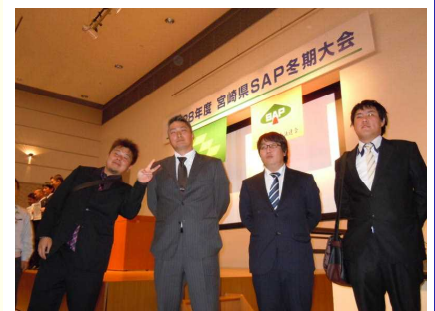
△西臼杵地区SAPの代表者

惜しくも入賞を逃す結果となりましたが、堂々と自らの想いや、日頃の活動成果について発表しました。本大会での発表は、貴重な経験となり、SAP会員の自信と成長につながりました。今後の活躍が期待されます。