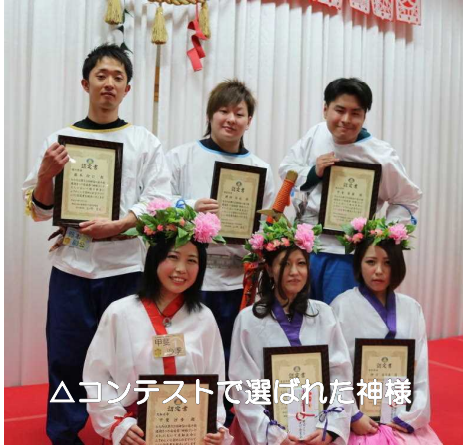
△コンテストで選ばれた神様

2月10日(金)と11日(土)に、高千穂町で「第32回神話の高千穂建国まつり」が開催されました。