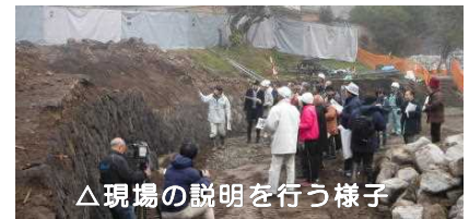
△現場の説明を行う様子

現在発注している工事の一部（左岸側の護岸）は、完成が近づいています。次回の見学会にもぜひご参加ください。