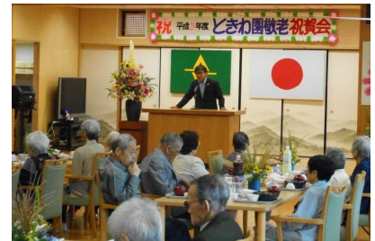
△ときわ園敬老祝賀会の様子

毎年9月15日から1週間は、老人週間です。今後ともご長寿を目標に末永く、毎日を元気にお過ごしください。