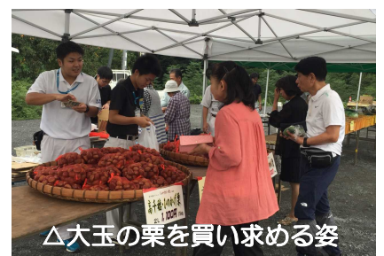
△大玉の栗を買い求める姿

会場では、栗のほか、キャベツやなす、ピーマンや乾しいたけ、ゆずなどの地とれ野菜も並びました。