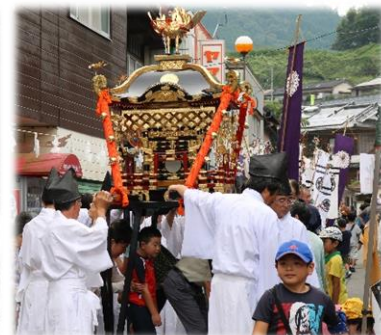
△多くの観光客が神楽観賞を楽しんでいました