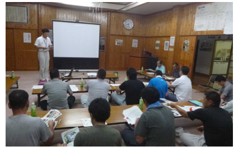
△普及センターの講義の様子

中山間地域の今後の農業を考えていくため、集落の産業部が中心となり、若手農業者の育成を目的に開催されたもので、活発な意見を交わす有意義な場となりました。