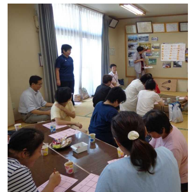
△つどいを通して交流を深めました！

この「つどい」をきっかけに、働いている障がい者の方同士の交流が広がっていくことが期待されます。