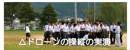
△ドローンの操縦の実演