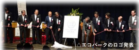
△エコパークのロゴ発表

世界農業遺産に続いて、2つ目の世界ブランドを有することになった西臼杵地域として、今後も継続して国内外に情報を発信し、地域の活性化に役立てることとなります。