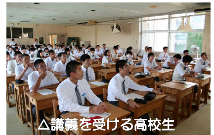
△講義を受ける高校生

今回の出前講座を機に、担い手確保が喫緊の課題となっている建設業界への就職を希望する学生が増えることを期待しています。