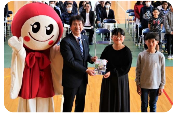
6年生が作成した観光リーフレット

今回作成したリーフレットは、町内の観光案内所、宿泊施設、観光スポット等に設置予定です。高千穂に立ち寄られた際には、ぜひ手にとってご覧になってみてください。