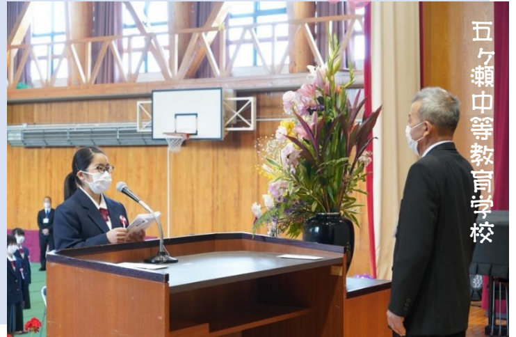
五ヶ瀬中等教育学校

4月10日（金）に高千穂高等学校で令和2年度の入学式が行われました。今年度は88名（男子51名、女子37名）の生徒が入学しました。