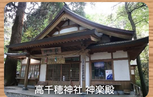
高千穂神社 神楽殿

一方、高千穂神社で行われる高千穂神楽は1年365日上演される観光客向けのもので、1972年から現在まで約50年間毎晩披露されています。本来33番ある舞の中から代表的な4つを短くまとめて公開しており、その演者を務めるのは、各集落の奉仕者(ほしゃどん)たちとなっています。