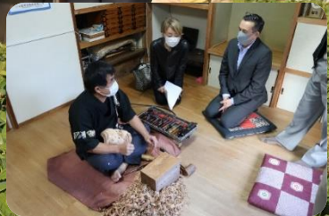
神楽面工房天岩戸木彫