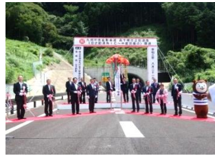
9月の開通式の様子

本県と熊本県を結ぶ九州中央自動車道は、九州の東西軸として、九州全体の産業・観光振興などに資するとともに、大規模災害時には、人命救助や救援物資の輸送等を担う「命の道」として極めて重要な道路であり、県北地域の暮らしや経済の進展に大きく寄与するものとして早期全線開通への期待が寄せられているところです。