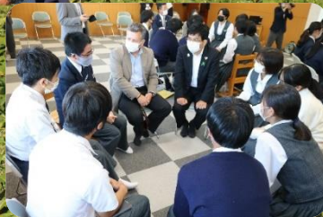
五ヶ瀬中等教育学校