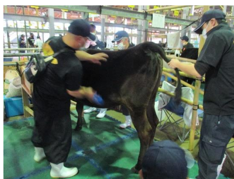
出品直前の入念な手入れ

今回の成績を弾みに、第12回全国和牛能力共進会への出品と上位入賞に向け、引き続き、生産者・関係機関一体となって取り組んでいきます。