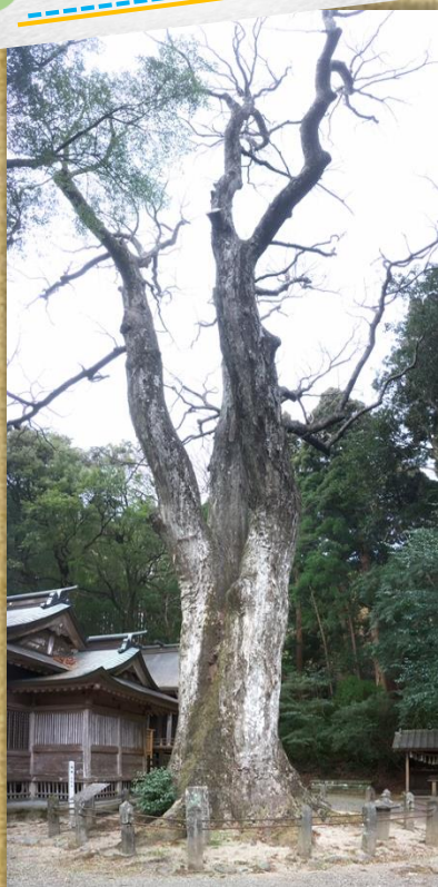
参照みやざき新巨樹100選(一部抜粋)

社殿に向かつて右手にある、あたりを覆いつくさんばかりのケヤキ。ケヤキとしては幹周り県内最大。建久3年(1192)に、大神惟基によつてこの地に神社が造営されたときに植えられたと伝えられています。大きすぎて見上げるのは一苦労ですが、その価値アリです。