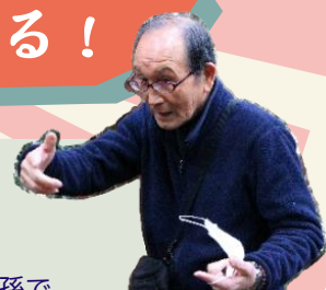
高千穂・五大水神保存会 うみの とむし 海塾 留良 代表