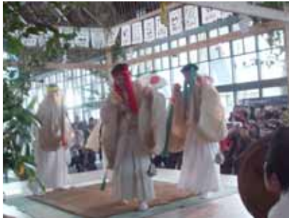
九州国立博物館で神楽を披露する桑野内神社神楽保存会

福岡県在住者の五ヶ瀬町の応援団「五ヶ瀬町夕日の里ふくおか町人会」の会員が同博物館関係者であったことから実現。当日は、保存会会員19人が、33番のうち15番を約5時間にわたって舞いました。