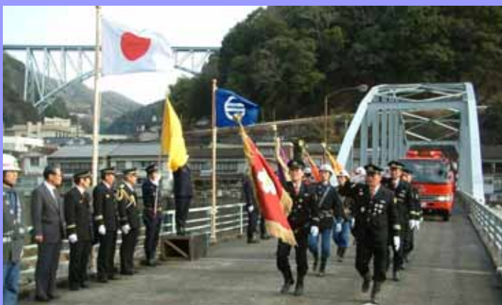
日之影町役場前の日之影大橋で行われた分列行進。左上は青雲橋

毎年新春恒例の消防始式（出初式）が、日之影町と五ヶ瀬町は1月5日に、高千穂町は1月8日に行われました。