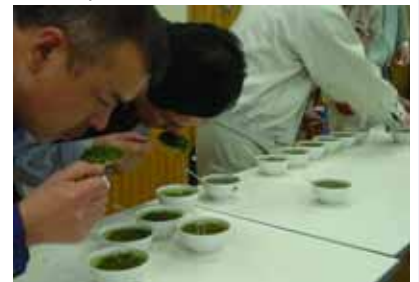
香氣(そう快な釜香を感じるものが良い)を審査している様子