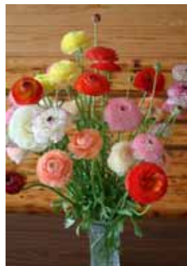
西臼杵支庁1階ロビーと支庁長室にランキュラスを展示しています。

キンポウゲ科の球根性の植物で、花言葉は「かわいらしさ」。その言葉通り明るく透明感のある色合いとふわふわとした花びらがとても可愛らしく、アレンジメント、ウェディング、プレゼントなど様々な場面で利用されています。涼しい気候条件を好み、本地域にとってもマッチした品目です。