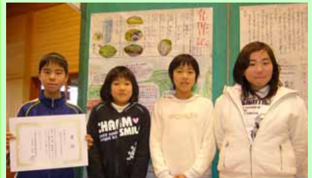
金賞を受賞した押方小学校5年生のみなさん（後ろの壁新聞が金賞を受賞した「育田日記」）