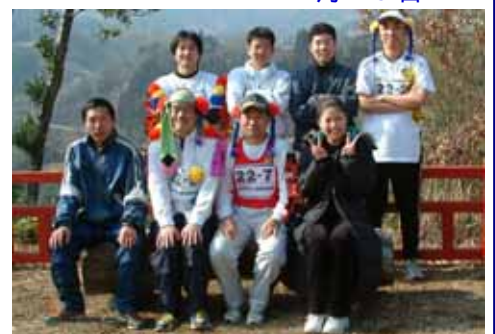
仮装して出場した西臼杵支庁走ろう会