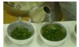
湯飲みに3gずつ茶葉を計りお湯を注ぎます。

西臼杵地区製茶品評会は、西臼杵地区茶業協議会の主催により、1月17日に西臼杵農業改良普及センターで開催されました。