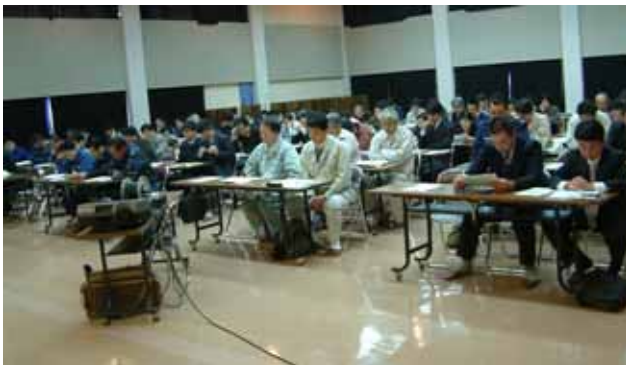
県危機管理局からの説明を聞く参加者

総合防災訓練では、トンネル事故対処訓練、ヘリによる重傷者の搬送訓練、ライフラインの復旧訓練、避難所運営訓練などが計画されています。