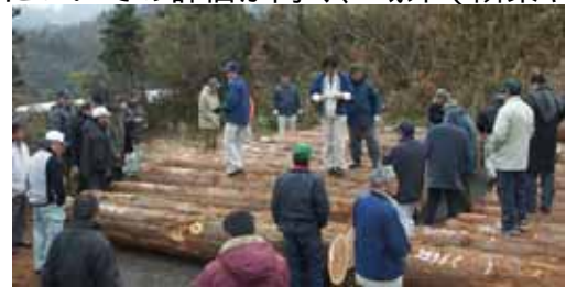
県森林組合連合会 高千穂林産物流通センターでの「新春初市」

当センターの取扱主品目である西臼杵スギ材は、品質、材色についての評価が高く、域外（隣県や都城、日南等）からも買いに来るほどの人気です。次回以降の市が期待されます。