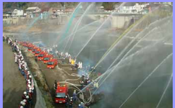
日之影町役場近くの五ヶ瀬川河川敷で行われた放水試験