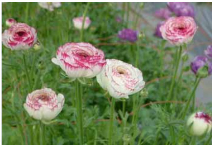
西臼杵地域のみで栽培されているめずらしい覆輪の品種「ちほの詩」(上の写真)と「ちほの舞」(下の写真)

西臼杵地域では、平成8年から県総合農業試験場の現地試験を経て、平成13年から本格的に「ランキュラス」の栽培が始まりました。