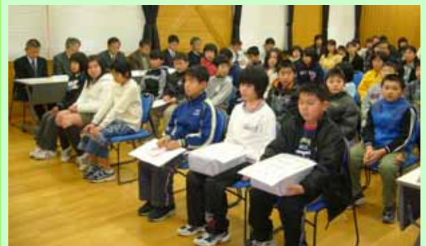
表彰式に参加した児童のみなさん