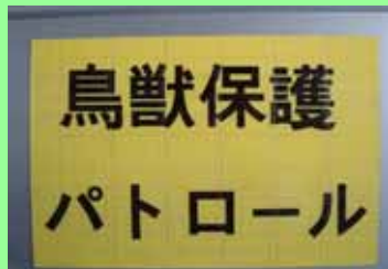
「鳥獣保護パトロール」のステッカーを公用車に貼り西臼杵管内を巡回しています。