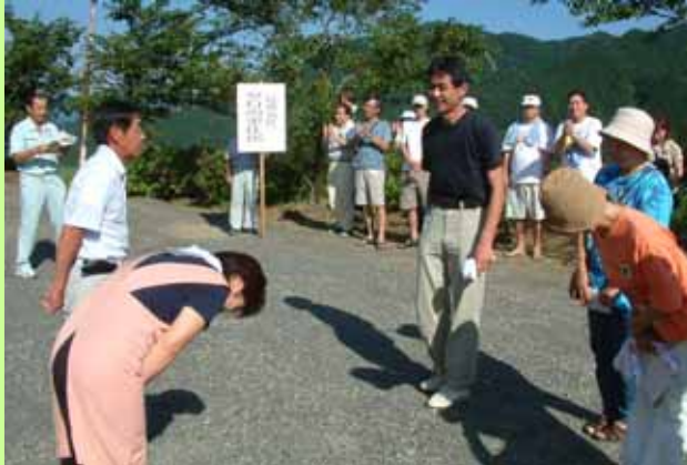
夕日の里の交流会は「ただいま」、「おかえりなさい」の対面式で始まります。

参加者は、鳥越川での川遊び、魚のつかみ取りやバーベキュー交流会、ふるさと体験タイム（トウモロコシ収穫、豆腐づくり、ブドウの袋かけ）などのグリーンツーリズムを楽しみました。