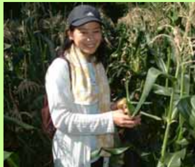
トウモロコシ収穫を体験