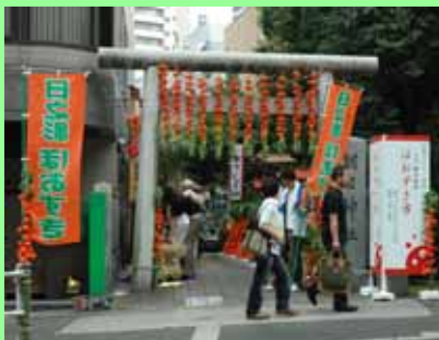
大きくて朱色が鮮やかな日之影産ほおずきは来場者に好評でした。