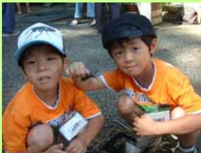
夜に街灯に飛んできたカブトムシをゲット