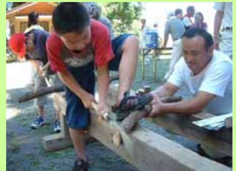
丸太切り体験（2日目は上組小学校の5、6年生も特別参加）