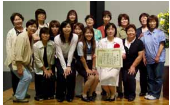
J A 高千穂地区から参加した皆さんとの記念撮影