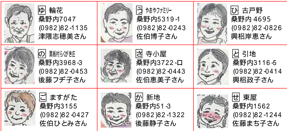
農村民泊の営業許可を受けた9軒の紹介(上から、下の地図の番号、屋号、住所、電話番号、代表者)