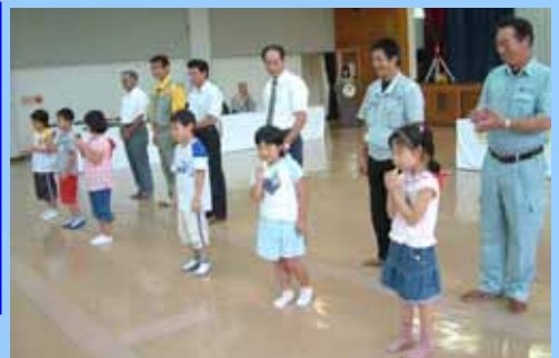
贈呈された笛を鳴らす高千穂小学校の児童