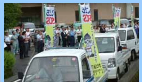
軽トラックに「こどもSOS」ののぼりを立てて、郡内を啓発するパレードを実施。