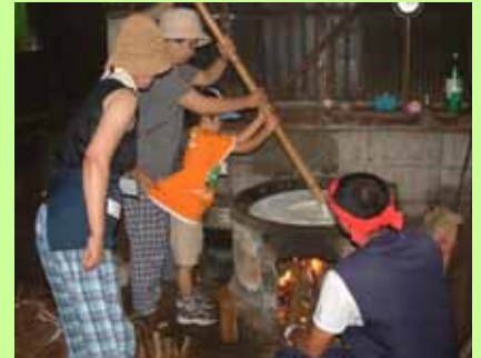
参加者の人気が高い豆腐づくり体験