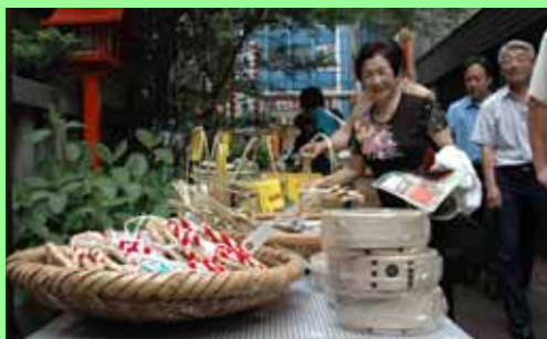
ほおずきと併せて、日之影町の特産品のPRも実施