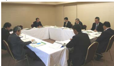
広域観光等について意見交換を行いました。