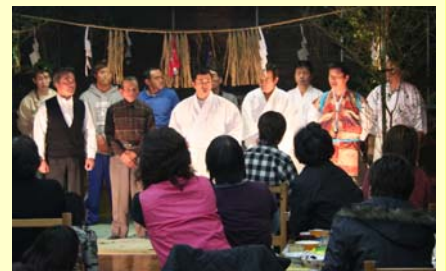
古戸野神社神楽保存会の皆さん