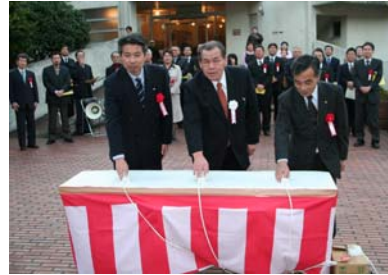
点灯式でスイッチを押す赤谷街路灯組合の興相組合長(中央)、飯干五ヶ瀬町長(左)、鈴木県地域振興課長(右)

今回建て替えた街路灯は65基。うち2基は、国道218号線沿で赤谷商店街への道しるべとなるモニュメント型の街路灯2基を設置しました。