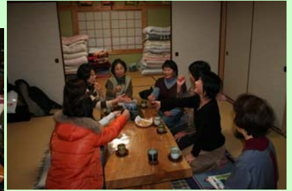
農村民泊も体験。農家民宿に分宿。