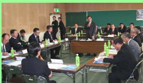
落合県商工観光労働部長や市町村長等が出席して行われた設立総会

この協議会では、県北地区企業立地戦略の検討や地域共通の奨励策等の検討、企業立地担当職員の研修会等が計画されています。