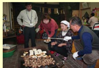
豆腐と芋の田楽も好評でした。