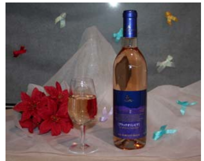
五ヶ瀬ワイン「ブラックオリンピア」