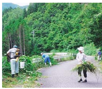
草刈り作業を行う地域住民の方々