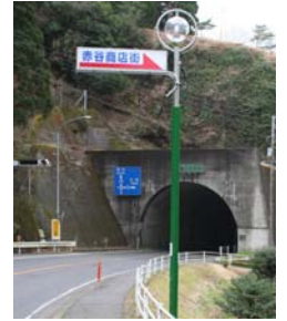
国道沿いに設置したモニュメント型の街路灯