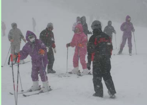
五ヶ瀬ハイランドスキー場でスキー・スノーボード体験。吹雪の中でしたが、インストラクターに教わりながら果敢にチャレンジ

県民自らが観光客となって県内観光地を訪れ、本県の良さを再発見することにより、自らが宣伝マンとなり、本県の観光リゾート地を県内外の知人等へ宣伝する効果も期待されます。