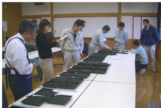
西臼杵地区の特産品である釜炒り茶を審査した西臼杵地区製茶品評会