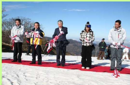
12月15日に行われたオープニングセレモニー