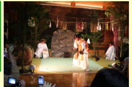
古戸野神社の夜神楽を披露

夕食は、夕日の里特産品・郷土料理部会が担当。同部会は、地域の行事や慣わし、それにまつわる料理と地元で取れる山野草を使った料理を「四季の御膳」として作り上げています。当日のメニューは、煮しめ、猪汁、地鶏の炭火焼き、田楽、むかご飯、とうきび飯、漬け物などでした。