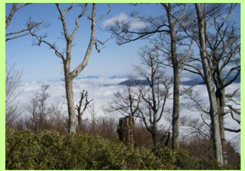
12月8日に行われた安全祈願祭の時には、すばらしい雲海を見ることができました。