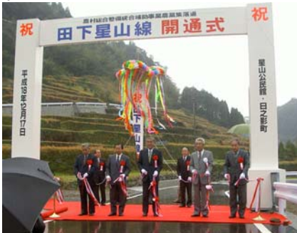
関係者約80人が参加して行われた開通式