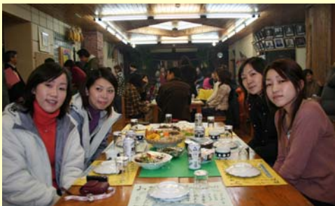
夕食を楽しむ参加者。めずらしい食事がいっぱい。